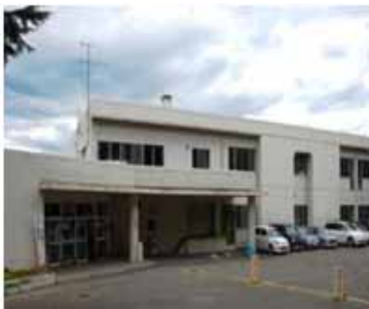
町立蓮野こども園