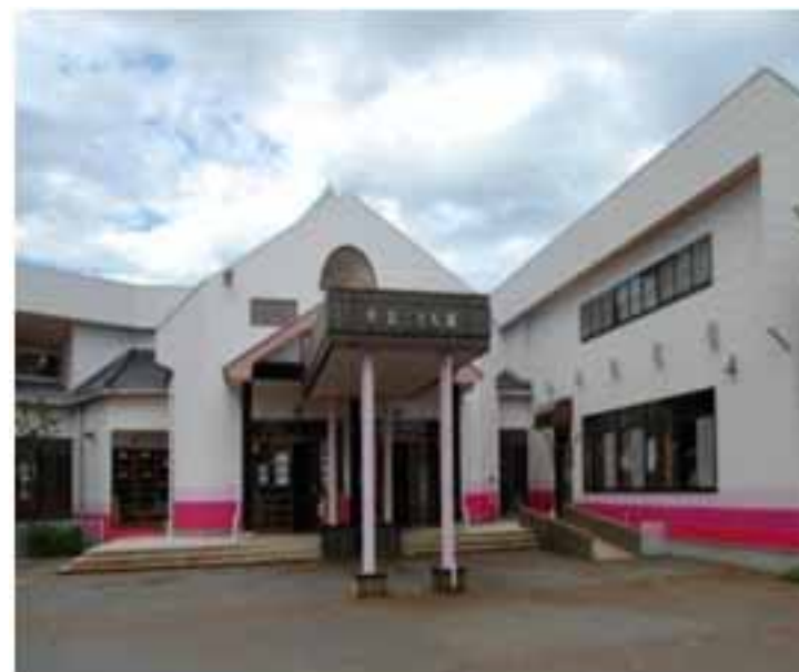
町立聖籠こども園(保育所)