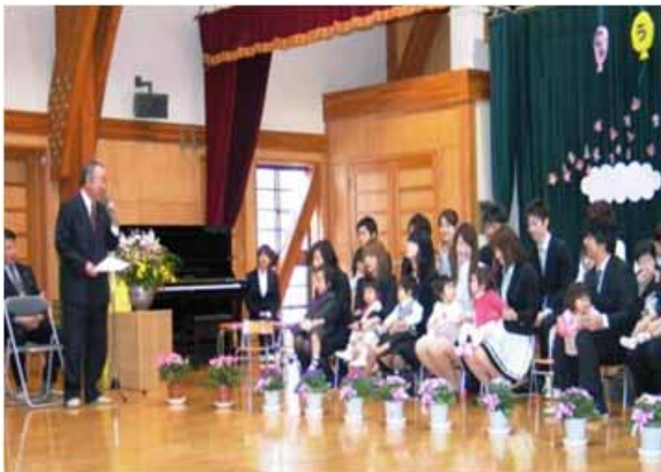
こども園の入園式