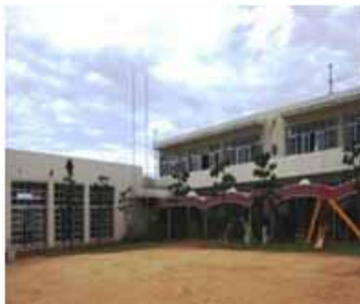
町立蓮潟こども園