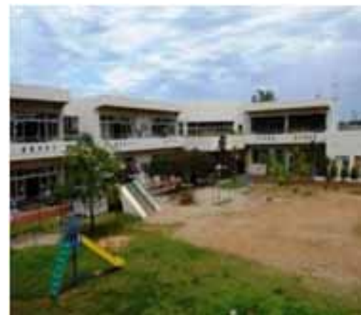
町立亀代こども園