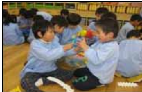
<楽しく遊ぶ園児（認定こども園みつみ）>

保護者が安心して就労できる、看護師の配置や病児・病後児保育の実施等様々な制度設計を考えていますが、財政面等厳しい状況にあります。