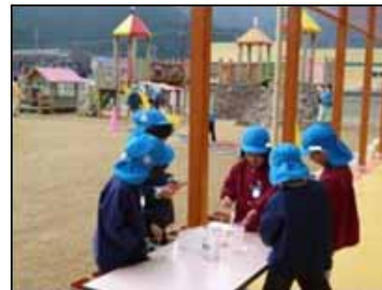
<園の様子(認定こども園あおがき)>