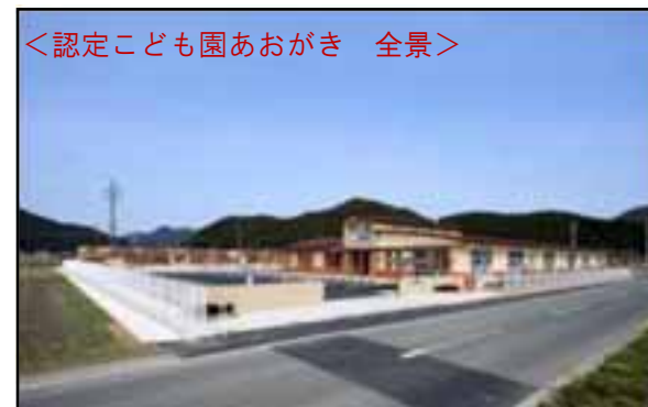
<認定こども園あおがき 全景>