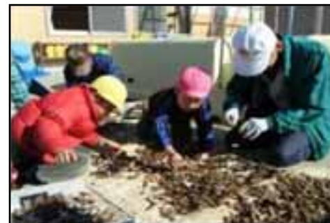
<地域の人と一緒に（認定こども園吉見こども園）>