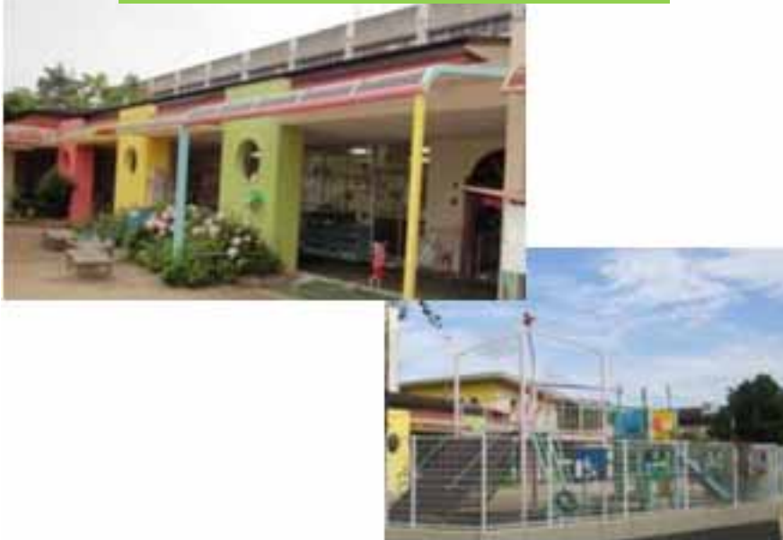
0～3歳児施設(保育所施設)