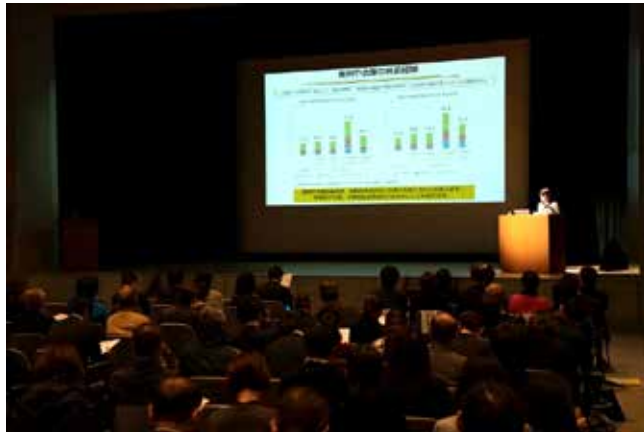
政府からの現状説明 (R1鳥取)