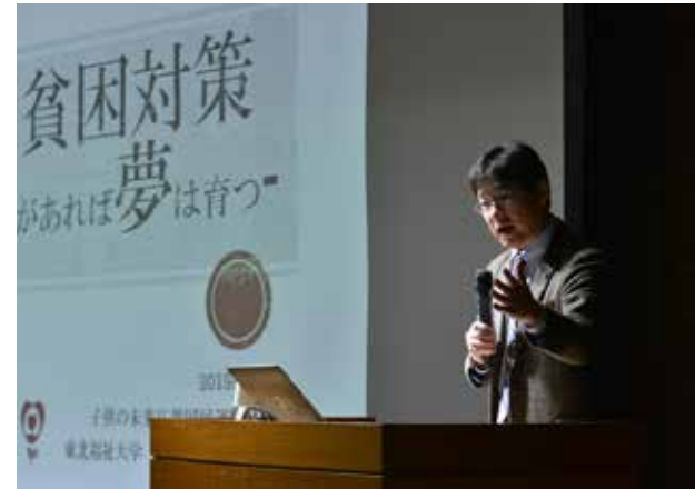
有識者による講演 (R1徳島)