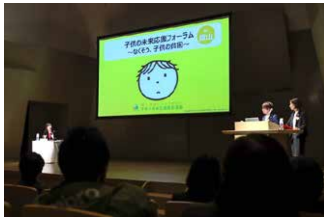
活動発表と質疑 (R1富山)