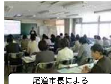
尾道市長による つくしプランの講話