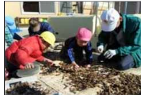
<地域の人と一緒に（認定こども園吉見こども園）>