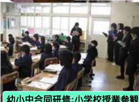
幼小中合同研修：小学校授業参観