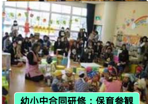
幼小中合同研修：保育参観