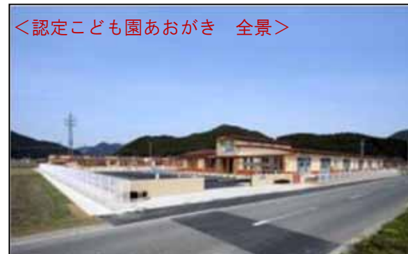
<認定こども園あおがき 全景>

平成23年4月現在までに、幼保連携型4施設、保育所型1施設が開園し、全て社会福祉法人が運営しています。施設整備については、土地は市が無償貸与し、園舎等は市の補助金で法人が整備しています。運営費については、必要となる経費を市が支援しています。現在、平成26年度、平成27年度の開園に向けて協議を重ねており、最終市内12園に集約する予定です。