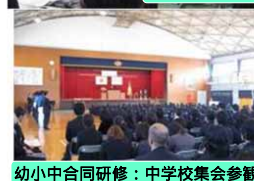
幼小中合同研修：中学校集会参観