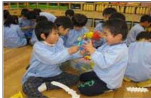
<楽しく遊ぶ園児（認定こども園みつみ）>

保護者が安心して就労できる、看護師の配置や病児・病後児保育の実施等様々な制度設計を考えていますが、財政面等厳しい状況にあります。