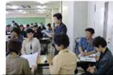
「しつけ3原則」の実践交流