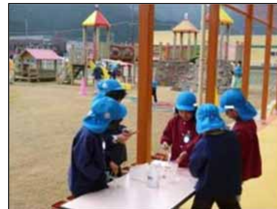
<園の様子(認定こども園あおがき)>