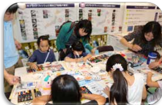
貝殻お絵かき体験(食育推進全国大会)