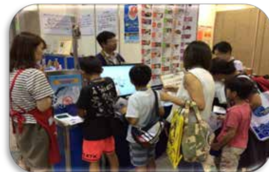
親子スタンプラリー(シーフードショー)