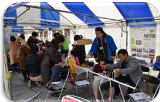
ロープワーク体験(ふるさとの食にっぽんの食)

その他、全国各地のJFグループで開催されるイベント等で、子育て世代の主婦や子供たちに向けた魚食普及や消費拡大を推進！