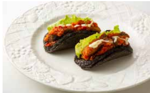
お魚料理チャレンジ部門 最優秀賞 「のりのオムレット&鯖でチリコンカン風」