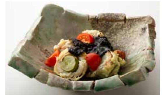
プロを目指す学生部門 最優秀賞 「マスカットカマス巻き海苔のバルサミソース」