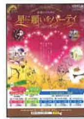
星に願いをパーティのチラシ