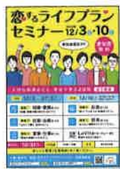
恋するライフプランセミナーのチラシ