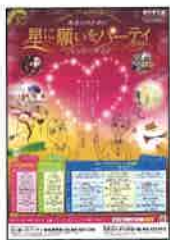
星に願いをパーティのポスター