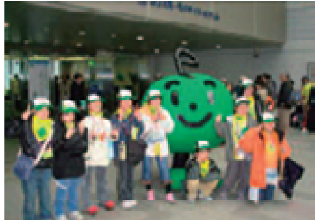
こどもエコクラブ全国フェスティバルinよこすか (神奈川県)

ら自主的に環境保全活動・環境学習を行うことを支援する「こどもエコクラブ事業」を地方自治体や企業等と連携のもと推進し、自然観察や水質調査などの環境学習やリサイクル活動などの環境保全活動に参加する機会を提供している。(2006年度末登録数:4,819クラブ、137,532人)