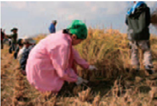
農業体験：稲刈りをする小学生（熊本県）

海や水産業、漁村に関する子どもたちの理解を深める上で重要な学校内外活動の一環として実施される体験漁業や自然体験活動を促進するため、体験漁業等の普及・啓発活動への支援や体験活動の場の整備を行うとともに、漁村の受入体制の整備や都市漁村交流の普及・啓発活動等の支援を実施している（体験活動の場となる漁村体験学習施設等を10か所整備）。