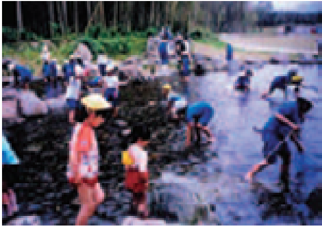
水辺の楽校プロジェクト（徳島県吉野川市 吉野川）

に近づきやすい河岸整備等（水辺の楽校プロジェクト：平成18年度末262か所登録）を行う『「子どもの水辺」再発見プロジェクト』（平成18年度末248か所登録）を実施している。