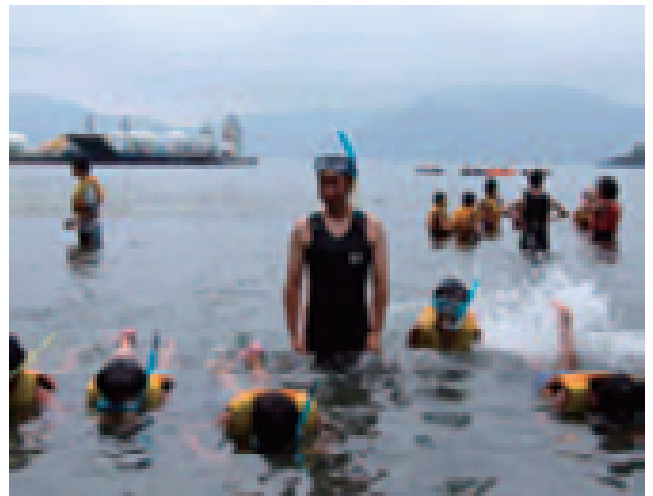
海辺の自然学校（岩手県釜石市）

海岸については、青少年等が海辺における自然体験活動を安全に楽しめ、また、都市・農漁村及び世代間の交流の場となる海岸を創出することを目的とした「いきいき・海の子・浜づくり」を全国32か所にて実施し、安全で良好な自然・景観を有する海岸空間の形成を図るとともに、自然体験活動等に利用しやすい海岸づくりを推進している。