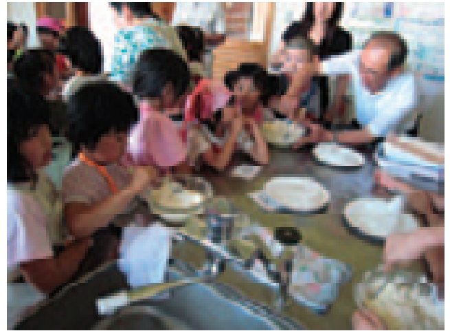
合川東いきいきタイム「じゃがいものおかしづくり」活動風景（秋田県北秋田市）

さらに、2007年度から、子どもたちの豊かな人間性を育むため、「省庁連携体験活動ネットワーク推進プロジェクト」を実施しており、複数の関係省庁と連携し、青少年に多様な体験活動の機会と場を継続的に提供する事業を行っている。