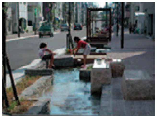
下水再生水を活用したせせらぎの創出事例（神戸市松本地区）

また、都市部にある下水処理場の上部空間や雨水排水路などを活用した水辺空間の整備を進めるとともに、下水処理水を都市部のせせらぎ水路の水源として送水する等の取組により、都市内において子どもたちが水とふれあう場の整備を行っている。