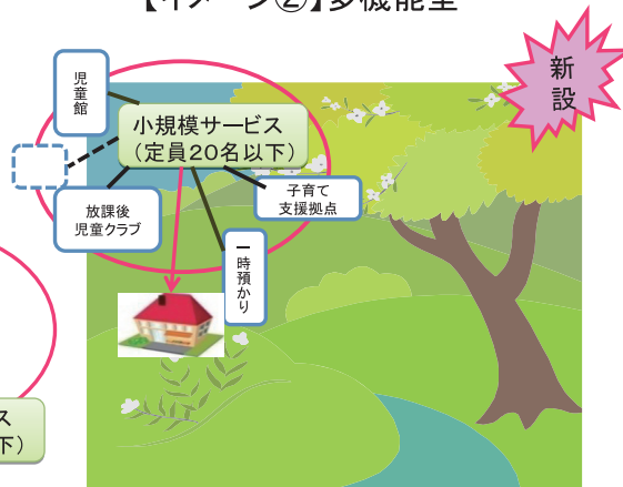
【イメージ②】多機能型