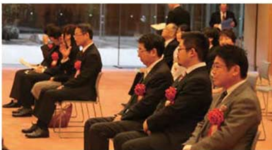
平成23年度バリアフリー・ユニバーサルデザイン推進功労者表彰 表彰式

国など行政だけではバリアフリー・ユニバーサルデザインを普及させることはできません。関係機関、関係者が広く本事例集をご活用され、様々な分野においてバリアフリー・ユニバーサルデザインへの理解と関心を深め、「共生社会」の実現に向けた心温まる活動の輪が広がっていく一助となりますことを期待いたします。