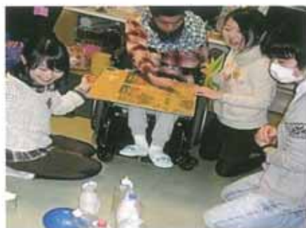
グループホームでのレクリエーションの様子

また、サークル活動で使用する名前入りの缶バッジ製作を近隣の福祉作業所へ依頼したり、年に2回のイベントでは利用者に劇や歌などの出し物に出演してもらうなど、学生自らが双方向的な関係を築くための工夫を行っている。このほか、ボランティア活動や障害への理解を深めるためのミーティング・勉強会の開催も行っている。