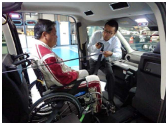
④シートベルトの着用