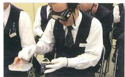
ユニバーサルエスコートマナー講習の様子(手話・車椅子補助・視覚障害体験)