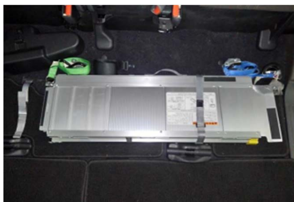
①あらかじめ組み立てたスロープ

(※車椅子の乗降時に重要なスロープの取付作業において、事前準備、連結作業の工程数の削減により、乗降時間を大幅に短縮させている。)