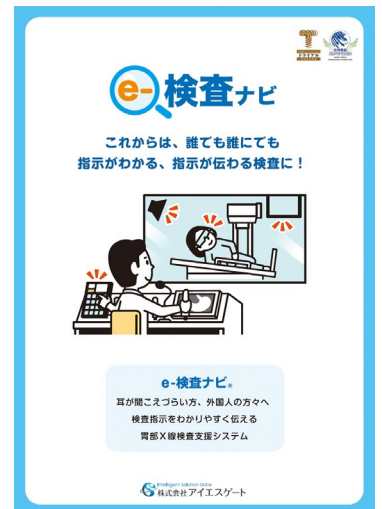
e-検査ナビ パンフレット表紙

➢ 株式会社アイエスゲートは、高齢者や聴覚障害のある方等の中に、がん検診で胃部X線検査を受けるときの指示を聞くことができないため、受診を断られたり、受診を諦めたりしていた方がいたことから、2017年に検査者の別室からの指示を従来の音声だけでなく、イラストやアニメーションでもモニターに表示して伝える「胃部X線検査支援システム (e-検査ナビ®)」を開発・製品化した。