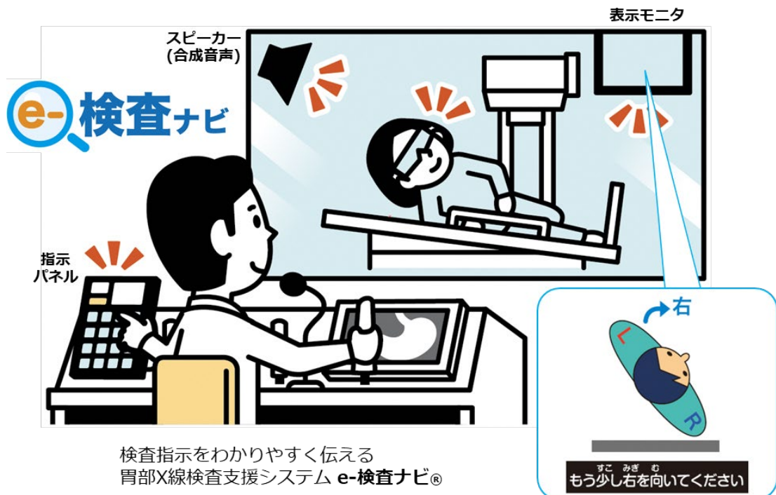
e-検査ナビの概要図

このシステムにより、検査中に口頭で体位変換の細かい指示を行うことが難しいという問題を解決することが可能となった。