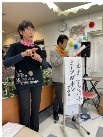
(ステージ上の手話通訳)