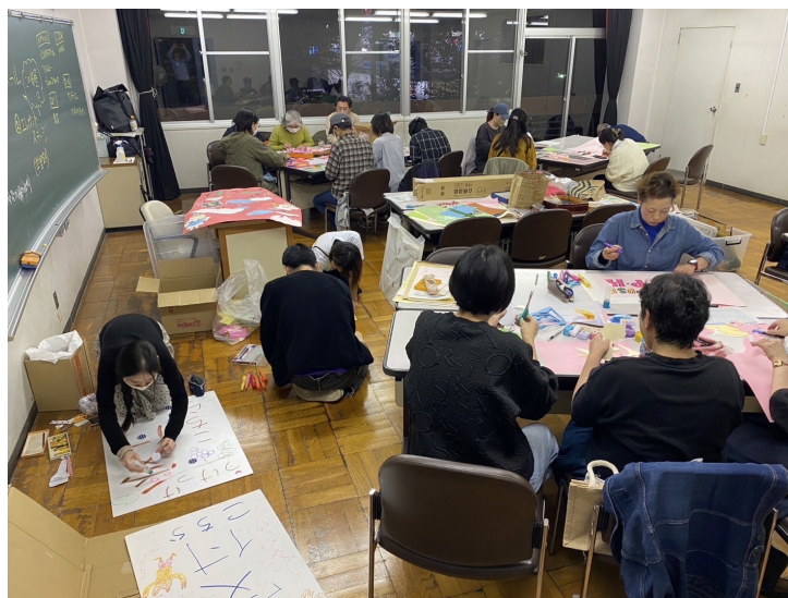
(音楽祭準備の様子)