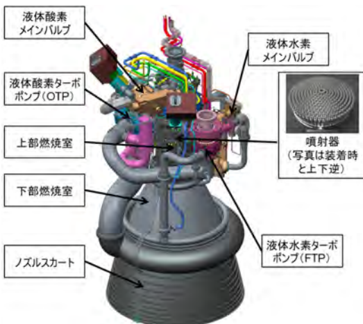
図 LE-9エンジンの概要