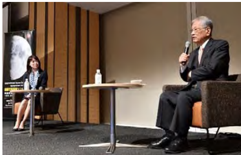
対談①「宇宙探査と人類」 (松本総研理事長、山崎直子宇宙飛行士)