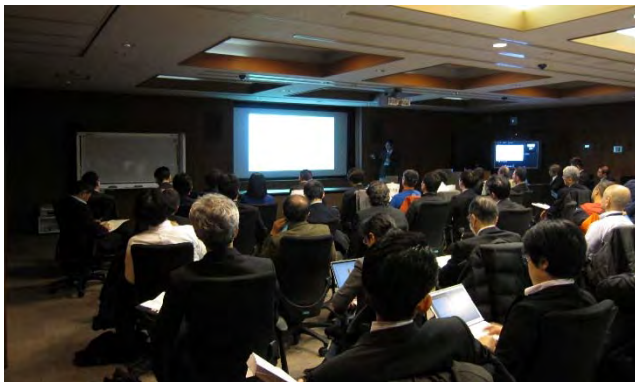
午前 タスクフォース活動報告