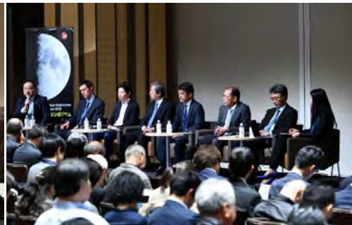
セッション2「宇宙探査産業の拡大 ～持続的な探査活動に向けて」