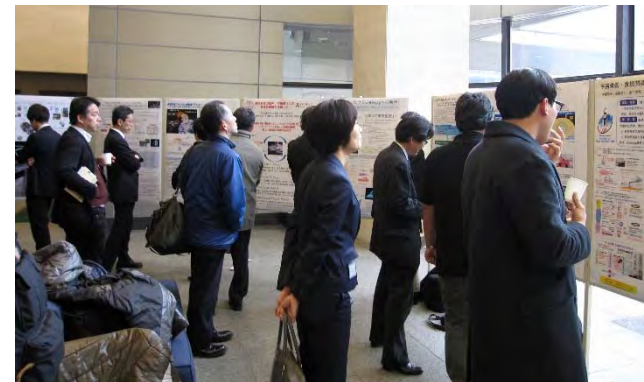
午後:ポスターセッション