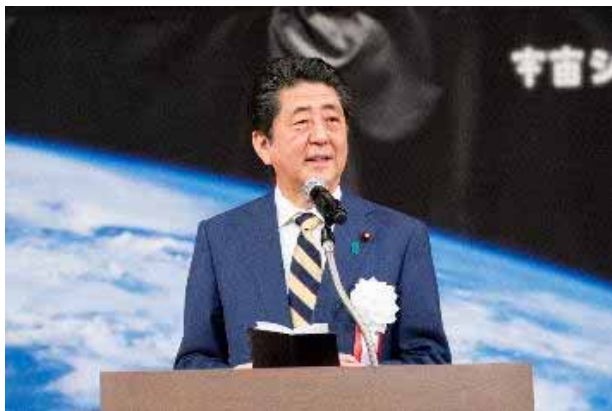
安倍総理が支援パッケージを発表