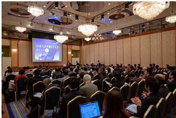
「S-Matching with 国研&ベンチャー」の会場

■ 約100人が参加。ピッチした研究成果を展示するコーナーを併設し、講演者と参加者や講演者同士、参加者同士が意見交換やネットワーキング実施。具体的な引き合いがあり、一定の成果が得られた。