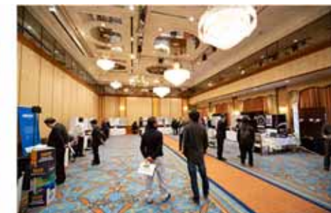
併設の展示コーナー