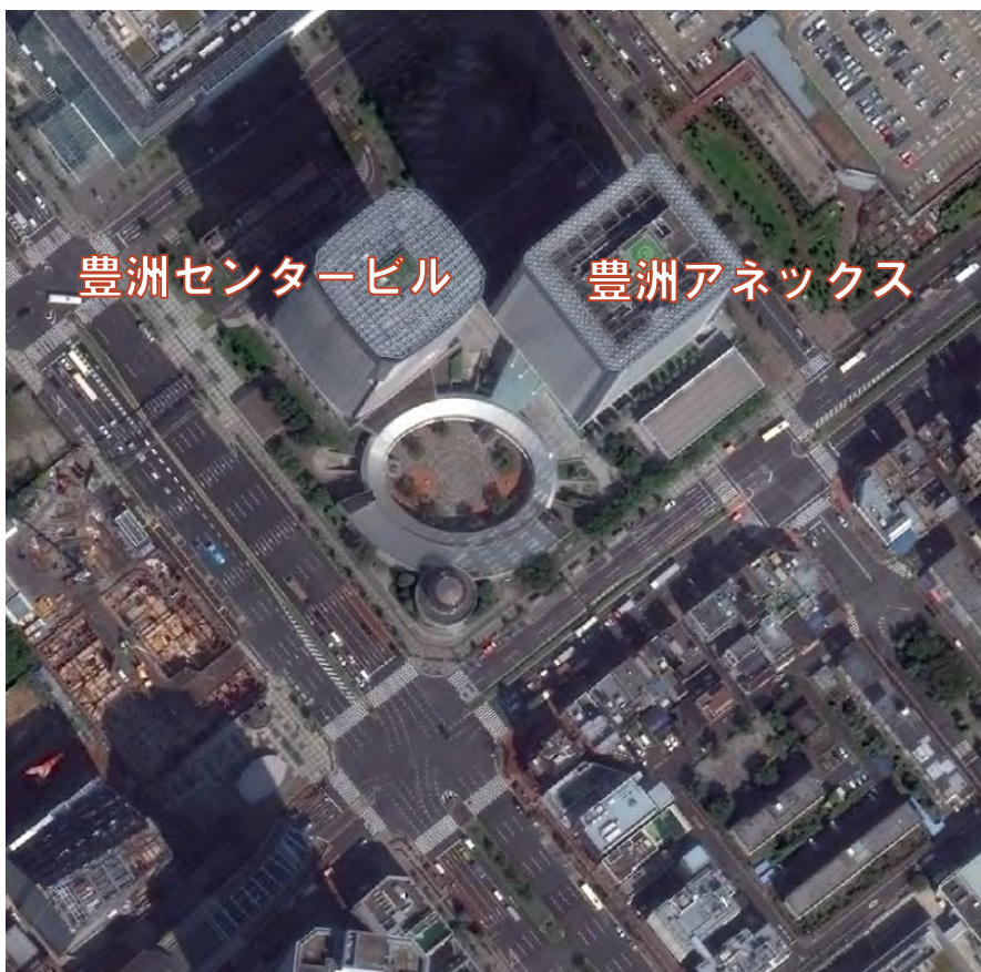
WorldView-3に撮影よる豊洲の画像 (40cm)

DigitalGlobe社の衛星画像と、NTTデータの画像処理技術の組み合わせにより、高さも幅も把握可能な高精細な3Dマップを提供しています。 WorldView-3の高い位置精度を誇る画像を用いることで、より正確な3D地図を作成することが可能となります。