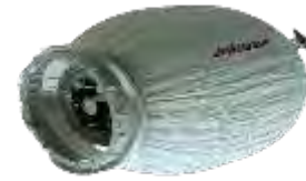
膨張式の宇宙ステーションモジュール 'BEAM'