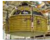
火星探査機 (Orion) の与圧室モジュール