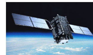
準天頂衛星「みちびき」