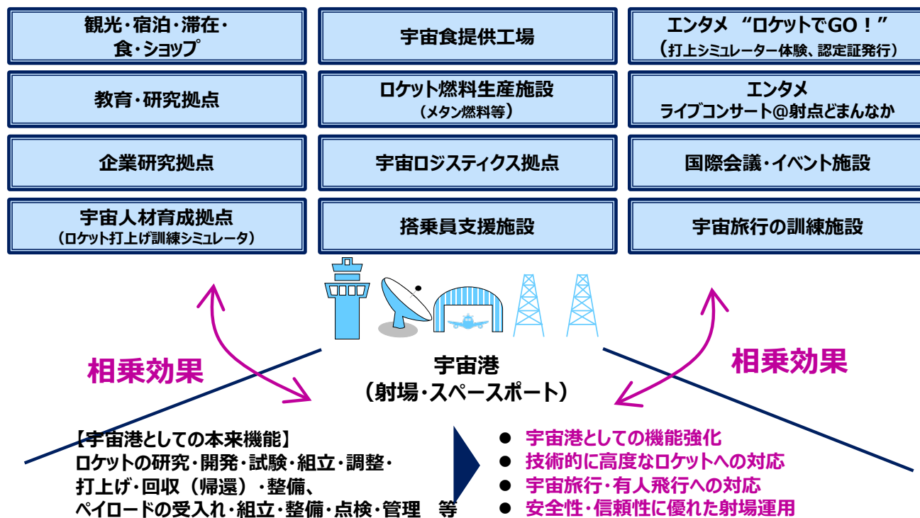
【図2：宇宙港の将来像】

におけるロケット打上げ運用や整備・組立等の本来機能を、安全性と信頼性をもって効率的に果たせる技術を向上させるとともに、企業の研究や教育拠点などの周辺産業との連携を通じて、更に技術的に高度な宇宙旅行などへ対応させることが求められる。このような取組を通じ、宇宙港を核に価値を創造し、地方創生へと繋げ、宇宙産業におけるイノベーションを創出し、我が国の宇宙輸送サービスのハブ拠点へと繋げていく。