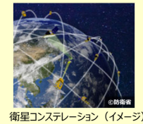
衛星コンステレーション (イメージ)