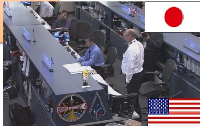
若田飛行士によるISSへの連絡・指示 (NASA運用管制室)