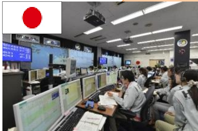
「こうのとりのとり」管制チームによる運用

「こうのとりのとり」が担う物資輸送は、ISSの運用に不可欠な任務です。日本の宇宙技術には、国際的にも大きな期待と信頼が寄せられています。 今後、「こうのとりのとり」がISSに到達した段階で行われるドッキングの主要な作業が、今回初めて日本人だけで行われます。宇宙の「チームジャパン」の活躍で、ミッションが成功することを楽しみにしています。 (2015年8月19日 総理談話)