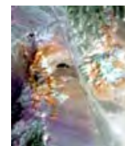
従来センサ (14バンド)

令和元年度に国際宇宙ステーションに搭載した石油資源を遠隔探知するためのハイパースペクトルセンサ (HISUI) の定常運用を行うと共に、得られた衛星データを用いた利用実証を実施。