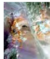
従来センサ（14バンド）

令和元年度に国際宇宙ステーションに搭載した石油資源を遠隔探知するためのハイパースペクトルセンサ（HISUI）の定常運用を行うと共に、得られた衛星データを用いた利用実証を実施。