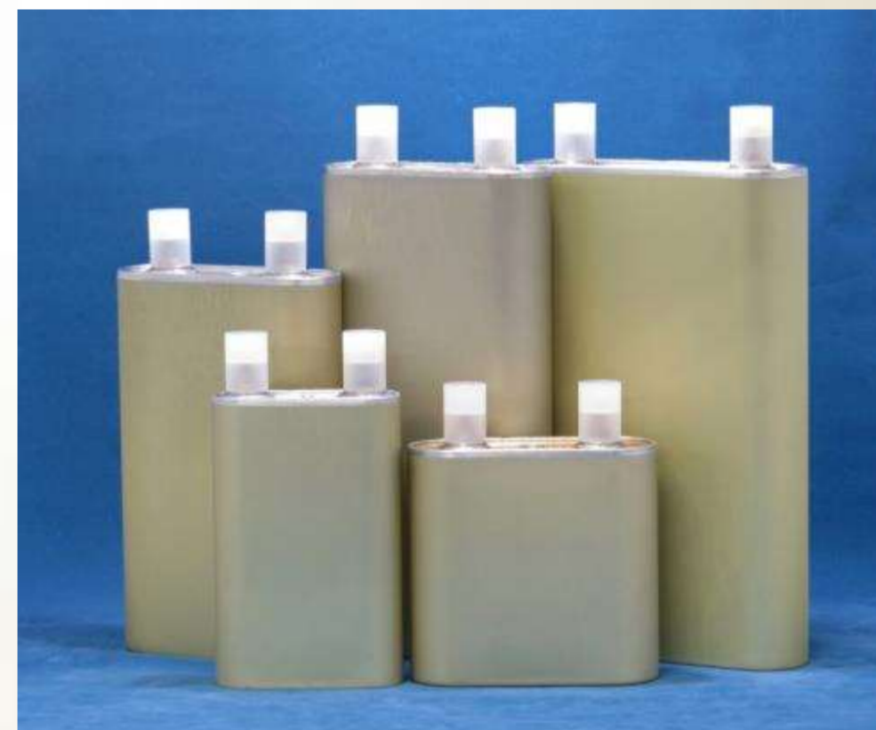
人工衛星用リチウムイオン電池の外観(一例)

各種国際学会の舞台での報告、またニュースリリースを通して、世界に広くアピールしている。最近では、国際宇宙ステーションへの当社製リチウムイオン電池の採用が新聞各紙で報道されている。