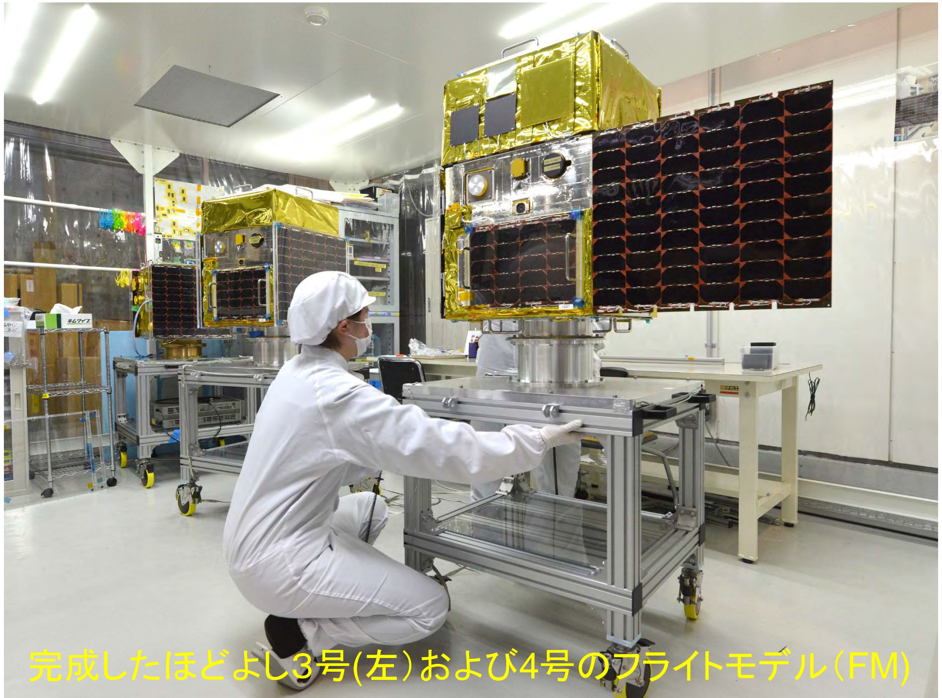
完成したほどよし3号(左)および4号のフライトモデル(FM)