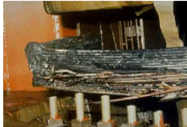
1989年の磁気嵐で停止した原発の変圧器

観測史上最大級の太陽フレア(1859年)が現代におきると、経済損失2兆USドル(米NRCレポート, 2008)