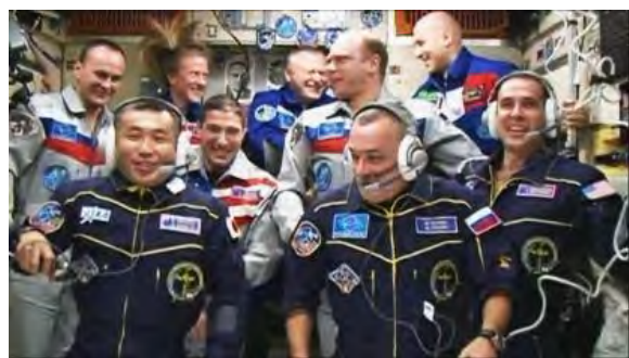
初のアジア人 ISS船長