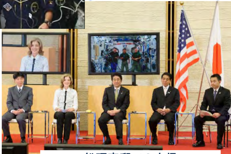
総理官邸での交信