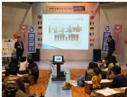
子育て支援イベント 伊勢志摩サミットって何だろう