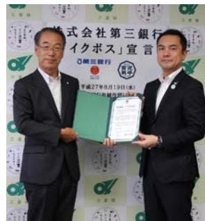
イクボス宣言 (知事と頭取)