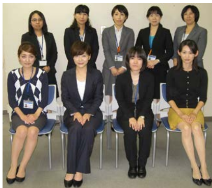
Lady Go! メンバー

地方銀行による仕事と子育ての両立環境の整備は、ローカルモデルのベストプラクティスとして進化し、地域の企業にも影響を与えており、将来、他の企業にも普及することが期待できる。