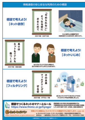
参加賞 (クリアファイル)

個人部門：総務大臣賞1点、協議会長賞3点、PTA関連賞4点、ネット社会の健全な発展部会特別賞2点、企業優秀賞数点 学校部門：総務大臣賞1点、総務省総合通信局長賞等11点