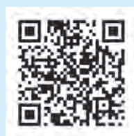
各都道府県警察の 少年相談窓口