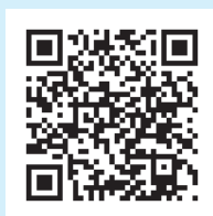
インターネット・ ホットラインセンター