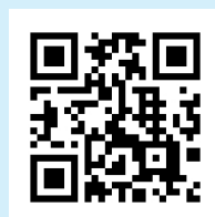
インターネット人権 相談受付窓口