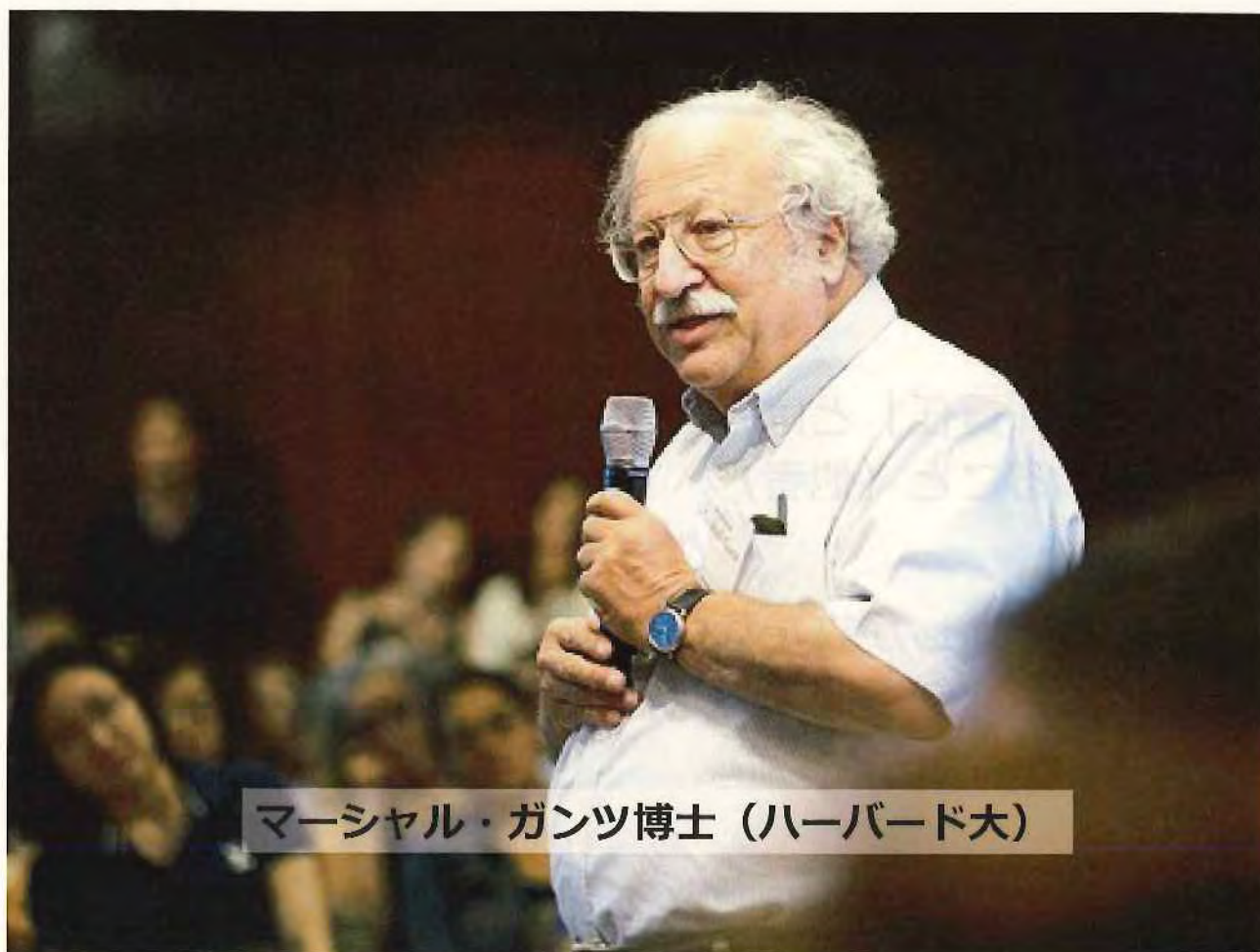
マーシャル・ガンツ博士（ハーバード大）