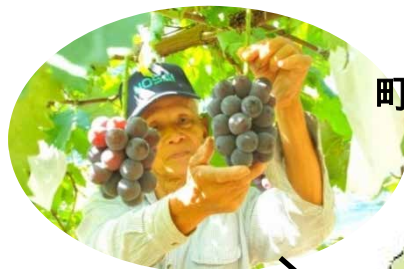
町の特産品:ぶどう