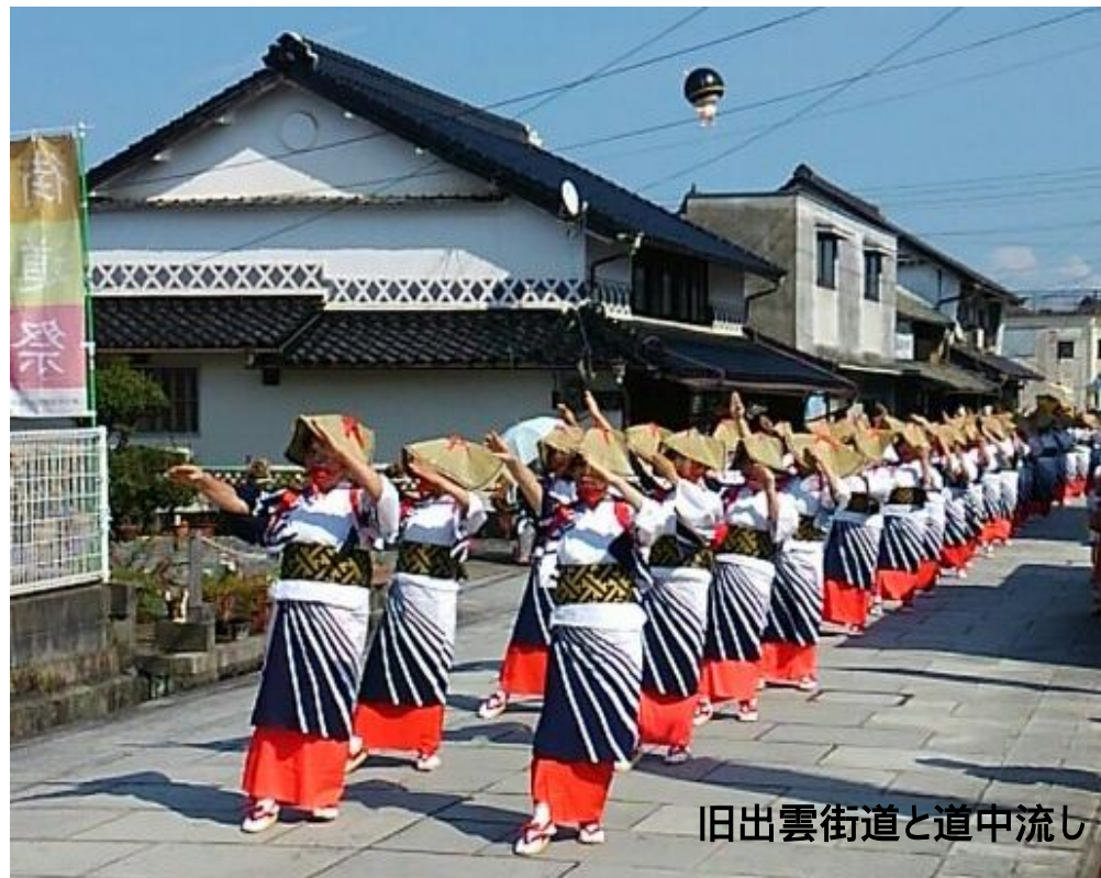
旧出雲街道と道中流し