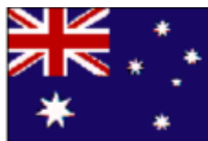
オーストラリア連邦