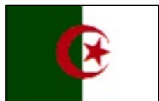
アルジェリア民主人民共和国