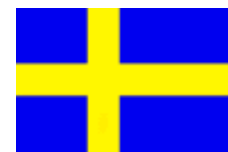
スウェーデン王国