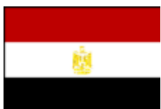
エジプト・アラブ共和国