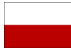
ポーランド共和国