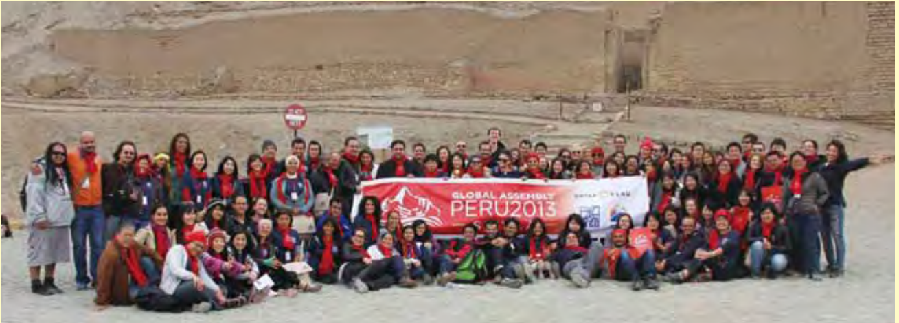
18か国から108名が参加 108 participants from 18 countries join the Global Assembly.