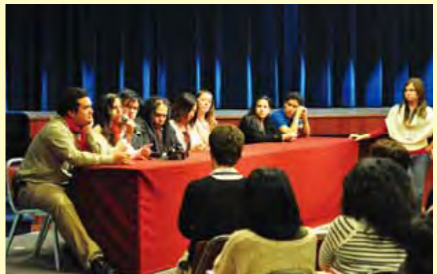
事後活動協議会では、各国の事後活動についての報告を行い、情報を共有する At the Conference for Post-Program Activities, participants report on the post-program activities implemented in each country and share the information.