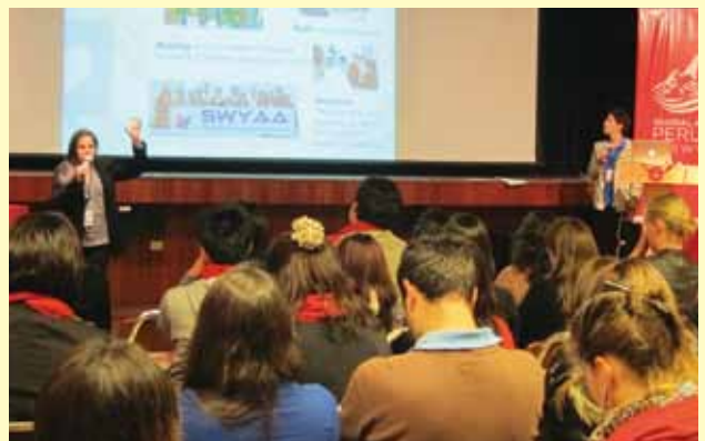
事後活動協議会での活動報告：数か国共同で実施している Learn Live Love プロジェクトは、貧困を無くすことを目的とし、教育、雇用、ボランティアをサポートする活動を行っている（ペルー） Report session at the Conference for Post-Program Activities: Learn Live Love is a volunteer project implemented jointly by ex-PYs from several countries which aims to eliminate poverty and by providing support for education, employment and volunteering (Peru).