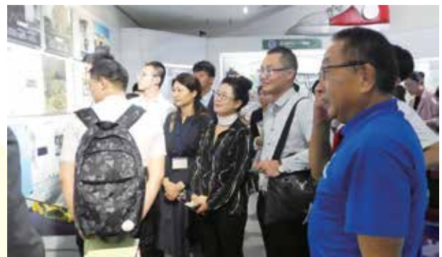
青山剛昌ふるさと館にて、館長より展示内容の説明を受ける