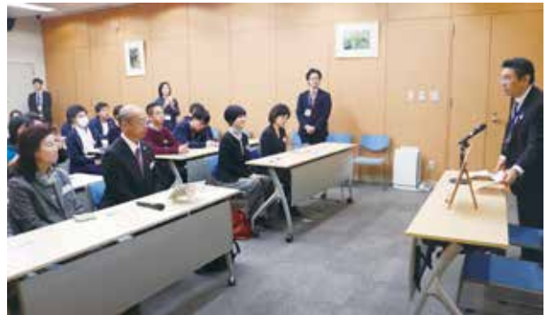
在中国日本国大使館を表敬訪問する（北京）