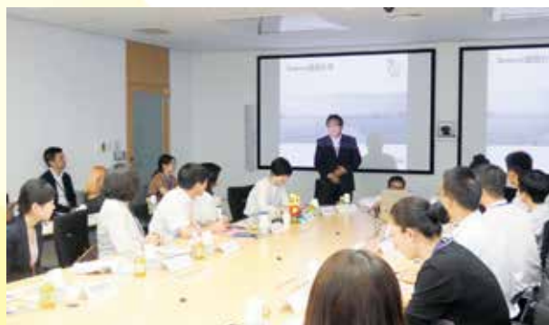
ベネッセコーポレーションにて、事業内容について説明を受ける