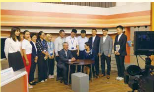
新日本海新聞社にて、ケーブルテレビのスタジオを見学する