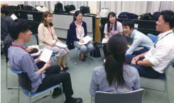
中国派遣団既参加青年からアドバイスを受ける (事前研修)