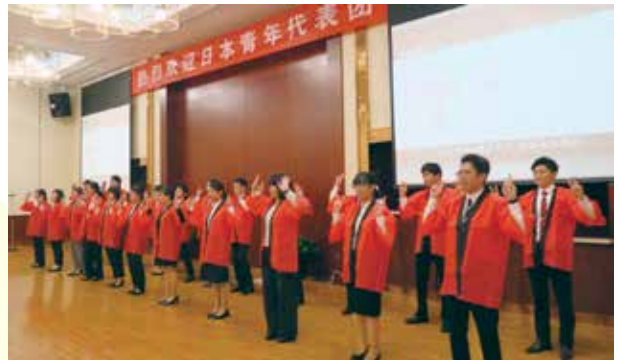
歓迎夕食会にて「東京五輪音頭2020」を披露する（北京）