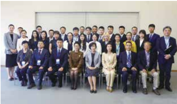
平井尚子函館市副市長を表敬訪問する