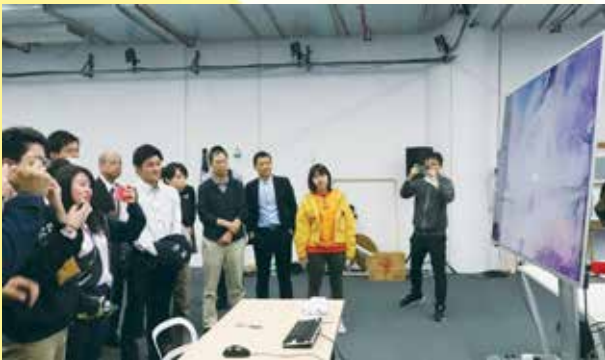
ネットイースにて会社説明動画を視聴する（杭州）