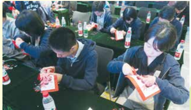
洛邑古城にて、中国の伝統工芸である切り紙を体験する（洛陽）