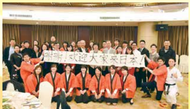
送別夕食会にて記念撮影をする（杭州）