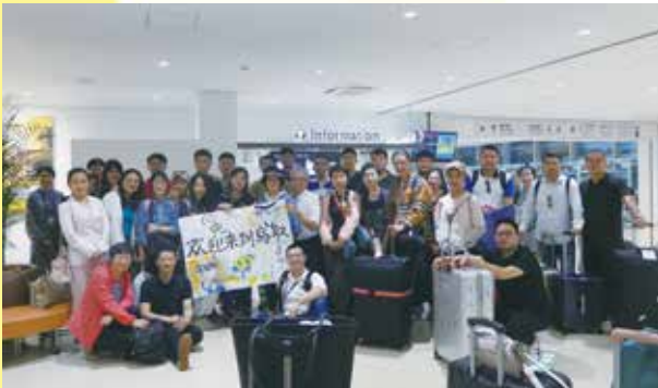
鳥取砂丘コナン空港にて、熱烈な歓迎を受ける