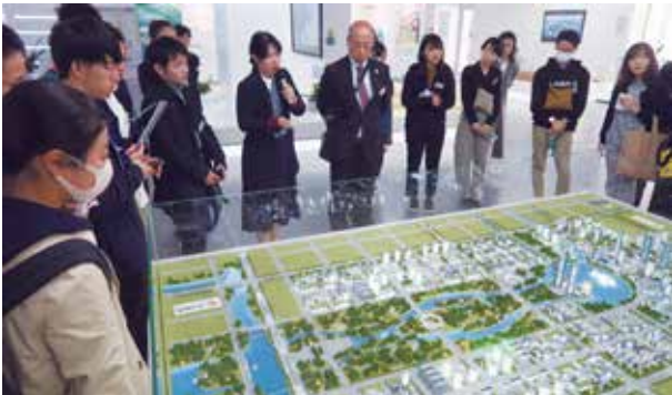
鄭州空港経済総合実験区にて、開発計画の説明を受ける（鄭州）