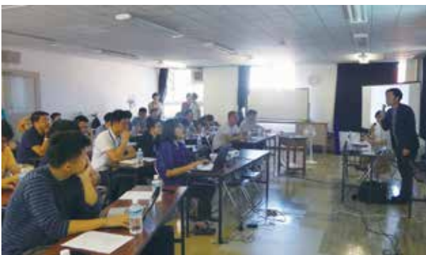
箱バル不動産の古民家を活用したまちづくりについて説明を受ける