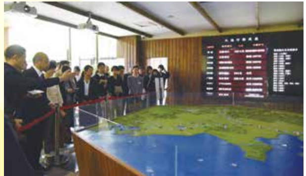
京杭大運河博物館にて説明を受ける（杭州）