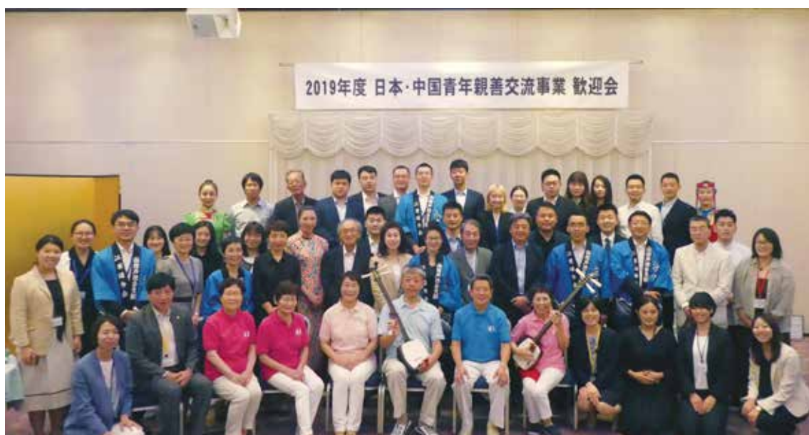
中国青年日本招へい団