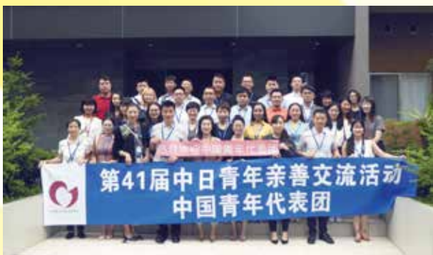
ドームレジデンス市ヶ谷にて記念撮影