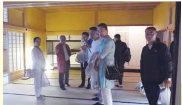
函館奉行所にて、ボランティアガイドの説明を受けながら見学する