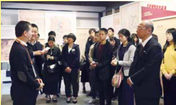
史家胡同博物館で説明を受ける（北京）