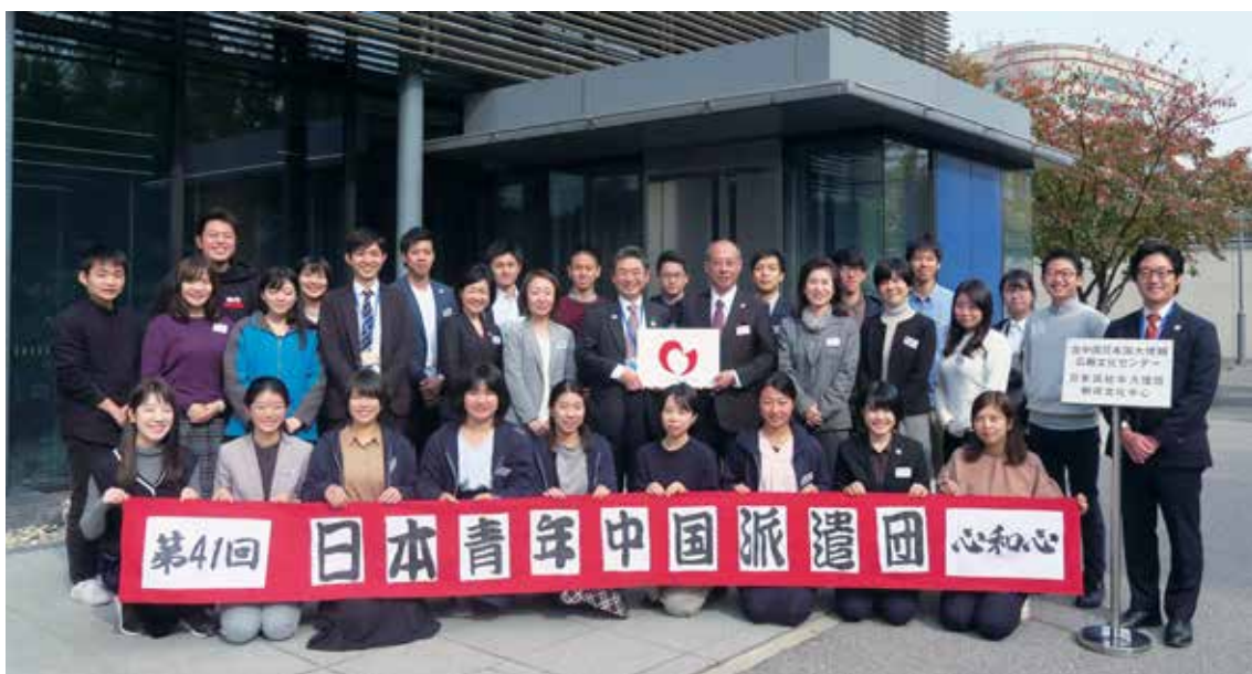
日本青年中国派遣団