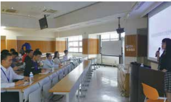
北海道教育大学にて、函館の地域振興と中国経済の関係について 講義を受ける