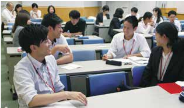
事前準備について係別に話し合いをする (事前研修)

日本青年中国派遣団は、事前研修、出発前研修及び帰国後研修を通じ、本事業への理解を深めるとともに、団の結束を固め、事後活動への意識を高めた。