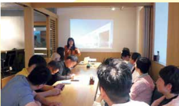
函館蔦屋書店にて、地域の居場所づくりの取り組みについて説明を受ける