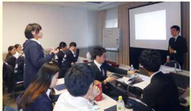
帰国後の事後活動について話し合う (帰国後研修)