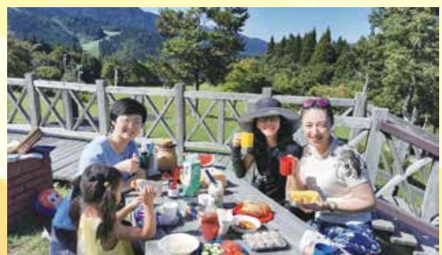
ホストファミリーと鳥取の自然を楽しむ