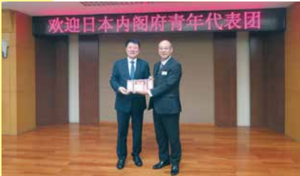
中華全国青年連合会を表敬訪問する（北京）

日本青年中国派遣団28名は、10月29日～11月9日の12日間、北京、鄭州、洛陽、杭州を訪れ、中国青年との交流や意見交換、施設訪問やホームステイを行った。