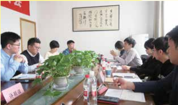
浙江工業大学にて中国青年と意見交換をする（杭州）