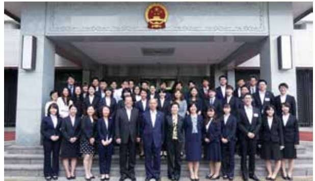
中華人民共和国駐日本国大使館を表敬訪問する (事前研修)