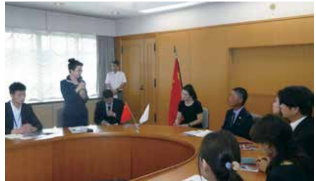
細羽正鳥取県交流人口拡大本部長を表敬訪問する