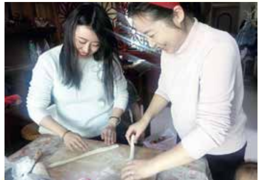
ホストファミリーから料理を教わる（鄭州）