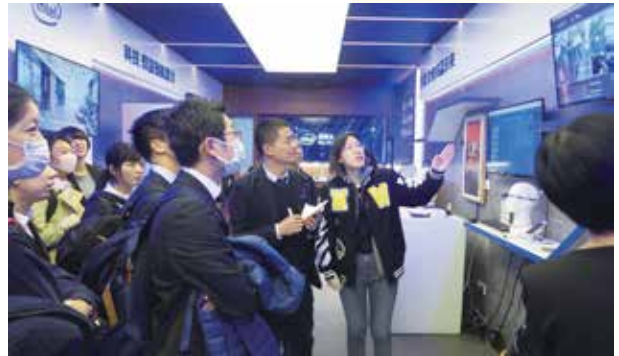
中関村創業大街にて最新技術の説明を受ける（北京）