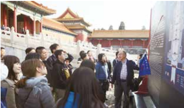
故宮博物院にてガイドの説明を受ける（北京）