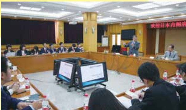
張季風中国社会科学院日本研究所副所長の講義を受ける（北京）