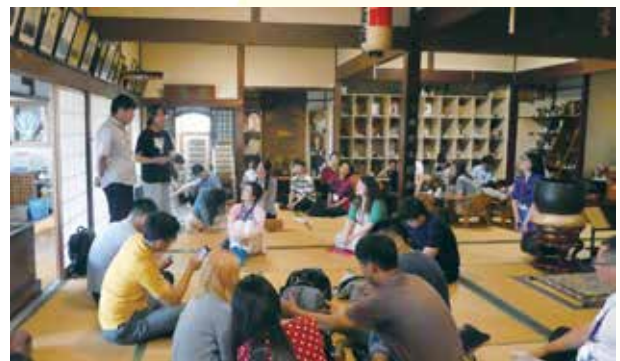
地元青年と意見交換し、成果を発表する