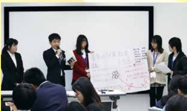
北京語言大学にて、中国人学生との意見交換の成果を発表する