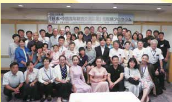
ホームステイマッチングにて、ホストファミリーと記念撮影