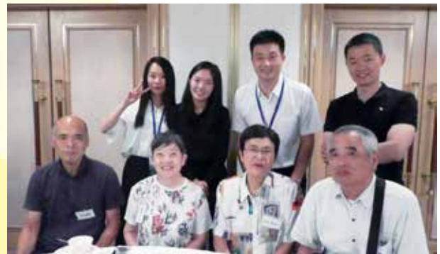
ホームステイマッチングにて、ホストファミリーと対面する