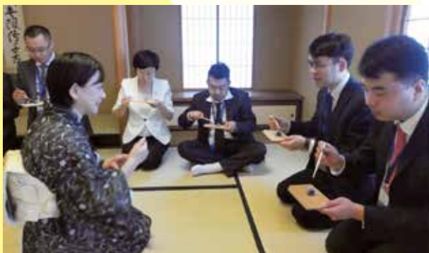
裏千家東京道場にて、茶道の作法を学ぶ