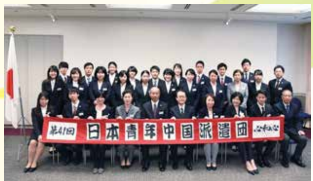
全日程を無事に終了し、全員で記念撮影する (帰国後研修)