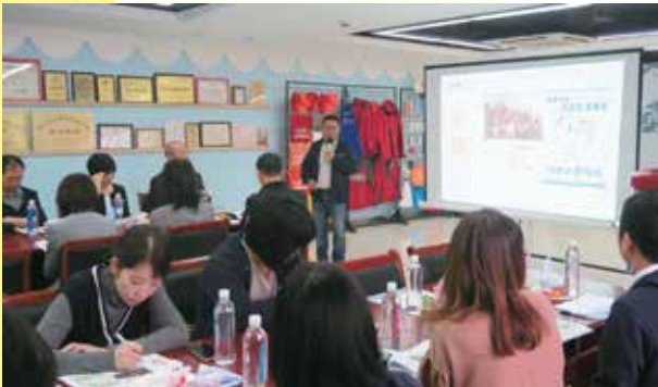
滴水公益にて活動内容の説明を受ける（杭州）