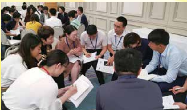
意見交換会にて、グループ別座談会を行う