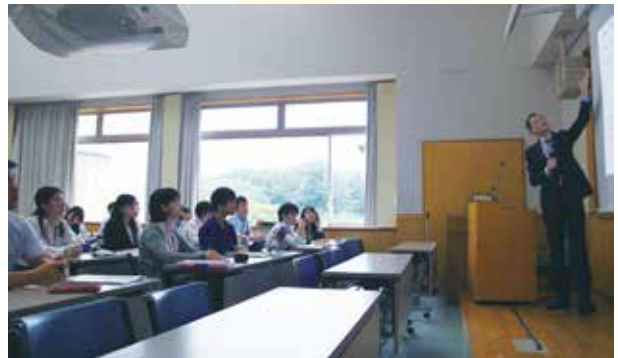
専門の講師から中国における起業についての講義を受ける (事前研修)