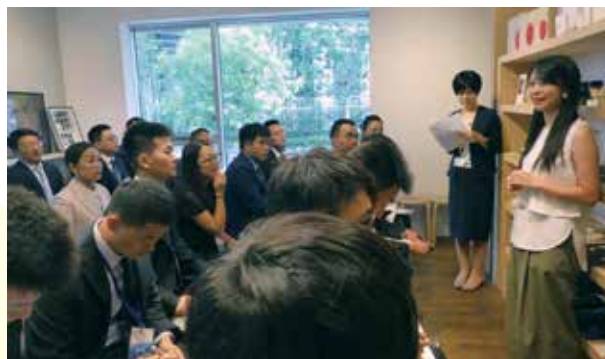
株式会社和えるにて、日本の伝統産業を次世代につなぐ取り組みについて話を聞く