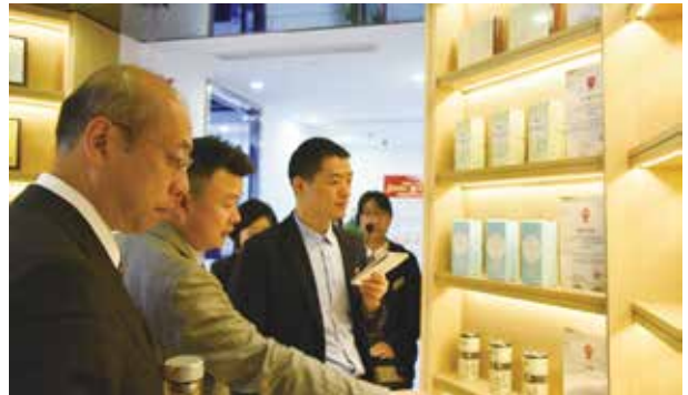
杭州芸福堂茶業有限公司にて商品の説明を受ける（杭州）