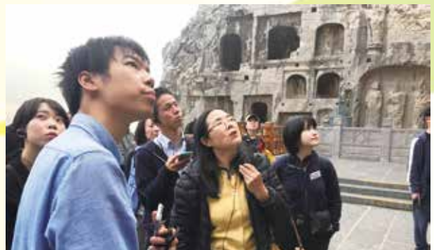
龍門石窟にて、ガイドの説明を聞きながら見学する（洛陽）