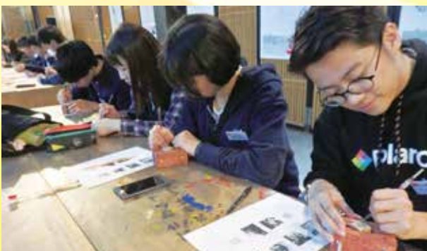
手工芸活態館にて無形文化遺産工芸の刻印を体験する（杭州）