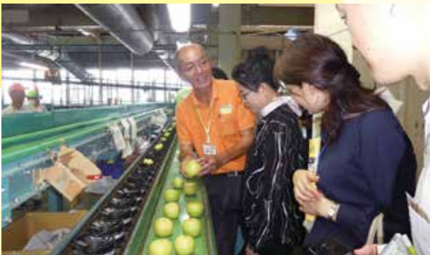
JA梨選果場にて、場長より梨の選果方法について説明を受ける