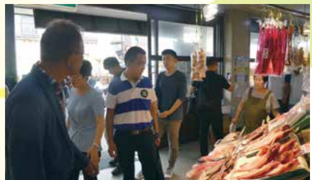
函館朝市を訪問し、説明を受けながら場内を視察する