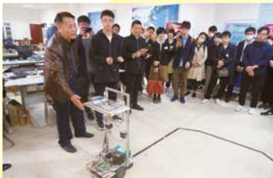
河南科技大学にて、ロボットセンターを視察する（洛陽）