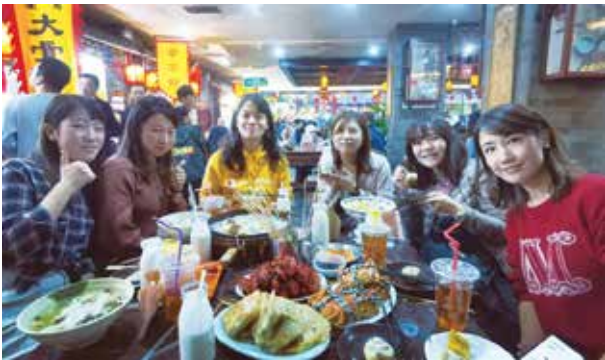
ホストファミリーと中華料理を楽しむ（鄭州）