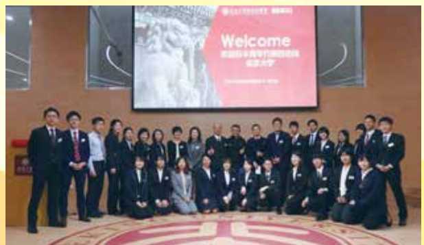
北京大学グローバル大学生創業イノベーションセンターにて記念撮影する（北京）