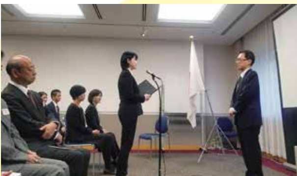
参加青年を代表して謝辞を述べる (帰国後研修)