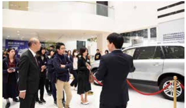
吉利グループにて、自動車事業について説明を受ける（杭州）