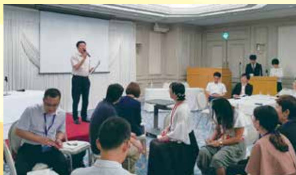
意見交換会にて、グループ別座談会の成果を発表する中国青年