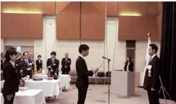
壮行会にて、大塚拓内閣府副大臣に参加青年代表が決意表明をする (出発前研修)