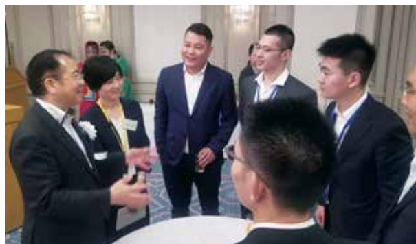
内閣府主催歓迎会にて、安藤裕内閣府大臣政務官と懇談する中国青年