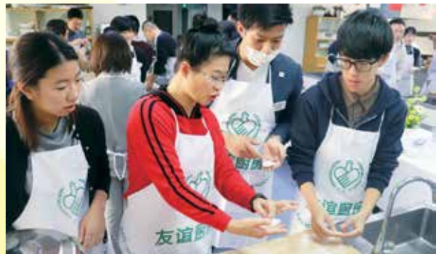
中国国際青年交流センターにて餃子作りを体験する（北京）