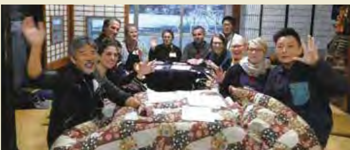
ゲストハウス「かたゑ庵」を訪問 Visiting a guesthouse “Katae-An”