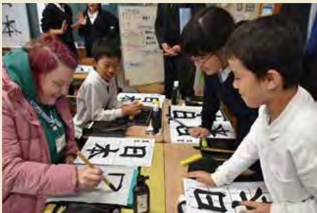
牧之原小学校にて生徒から書道を学ぶ Learn how to write Japanese calligraphy from students at Makinohara Elementary school