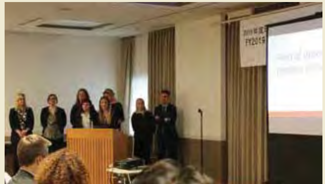
分野別発表（障害者分野） Presentation of Outcome by Field of Activities (Persons with Disabilities)