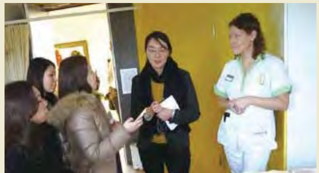
ヴィランスにて、説明を受ける

Visiting facility tour at Rozentuin and learning about the everyday lives of the user