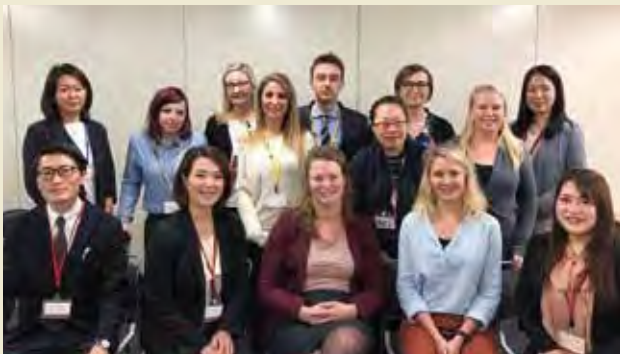
ヴィスト株式会社を訪問する Visiting VISST Corporation