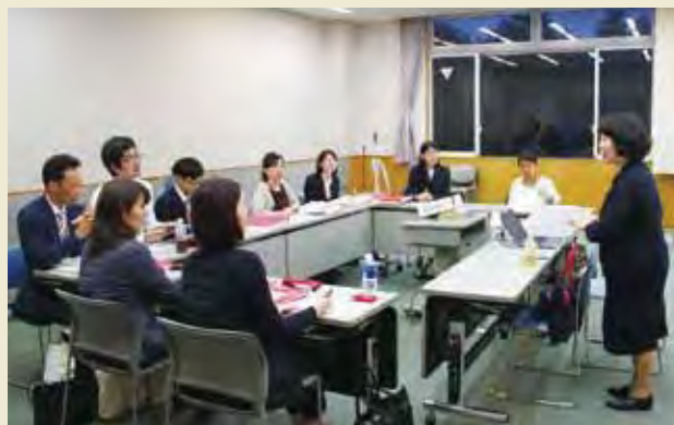
事前研修での外部講師による講義（高齢者分野） Lecture by experts on each field of activities at Preparatory Seminar (Field of Older People)