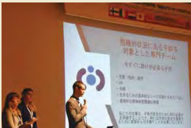
地方セミナーにてオランダ団によるプレゼンテーション Presentation by delegation from the Netherlands at Local Seminar