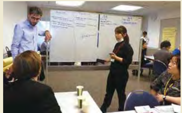
ディスカッションの様子(トピック2) Discussion (Topic 2)