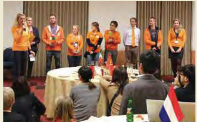
文化交流会(オランダ団によるクイズ大会) Cultural Exchange Program (quiz game presented by Dutch Delegation)