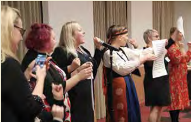
文化交流会(フィンランド団による歌の披露) Cultural Exchange Program (performance of songs by Finnish Delegation)