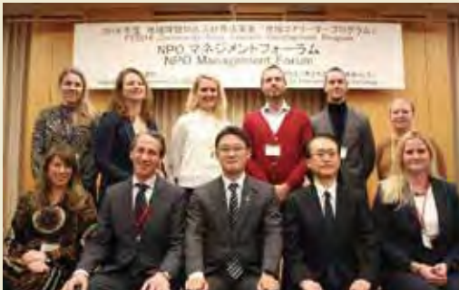
オランダ招へい団 Delegation of the Netherlands