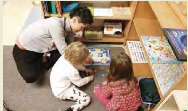
モンテッソーリ幼稚園「モンツァ」を訪問し、園児と交流する

Visiting Montessori Kindergarten Montsa and playing with children