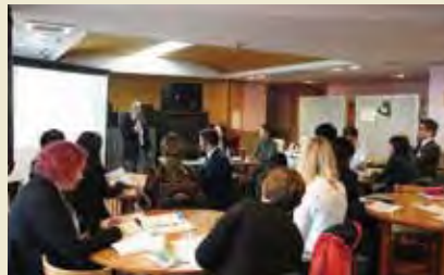
社会福祉法人江東園 Social Welfare Corporation Kotoen

トピック2 「共生社会を支える多様な人材の活躍促進」 Topic 2: Encouraging participation of various people to support Cohesive Society