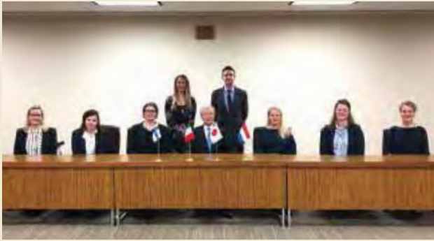
竹中博康石川県副知事を表敬訪問 Courtesy Visit to Mr. Hiroyasu Takenaka, Vice Governor of Ishikawa Prefecture