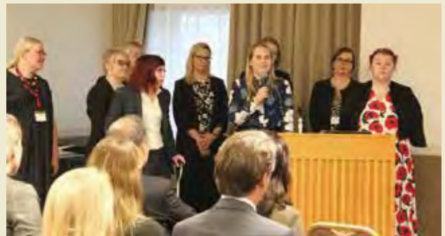
国別発表（フィンランド） Presentation by Country (Finland)