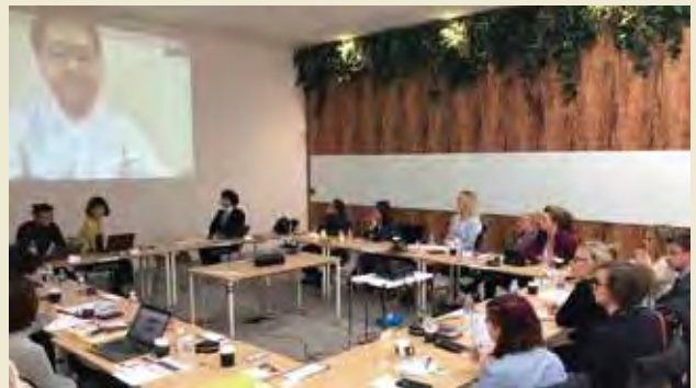
合同会社DMM.comにて在宅勤務をする職員の話聞く Learning about the experiences of the staff working from home using their tele-work system at DMM.com