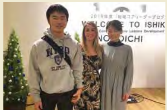
ホストファミリーとのマッチング Homestay matching with host families