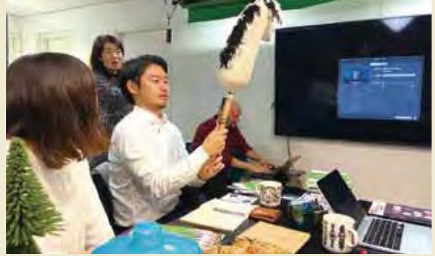
デジタルユースワーク専門技術センター「ベルケ」を訪問し、ホビーホースのデジタルライゼーションの仕組みを知る

Visiting Allianssi National Youth Council of Finland and learning about their information center