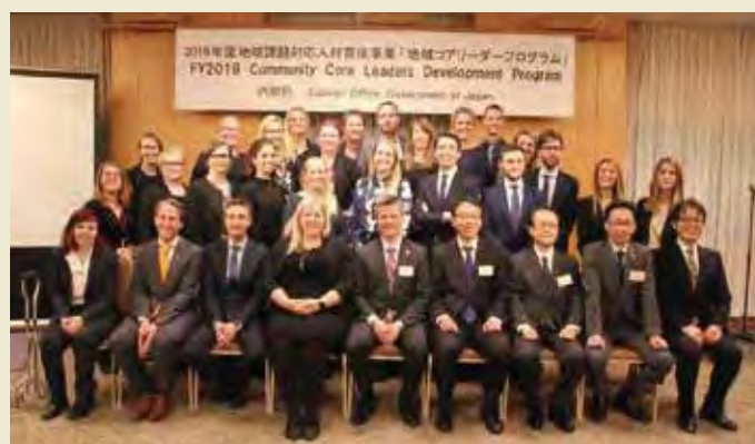
歓送会 Farewell Reception