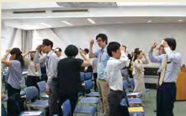
事前研修での英語コミュニケーション講座 English Communication Session at Preparatory Seminar