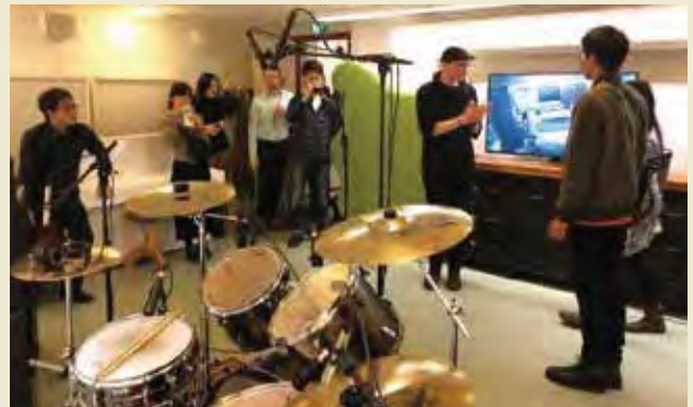
青少年活動ハウス「キピナ」の音楽スタジオを見学する

Visiting Ministry of Education and Culture and receiving lecture on the youth administration