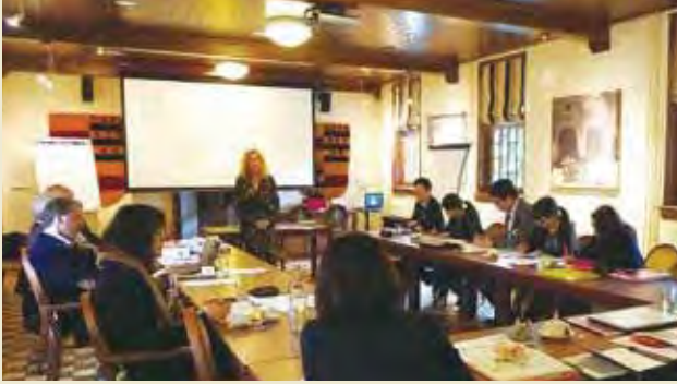
ナイエンローデ・ビジネス大学にて、アンボ高齢者ユニオンの説明を受ける

Receiving introduction of the Anbo Elderly's Union (ANBO) at Nyenrode Business University