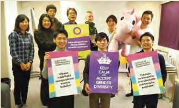
LGBTI権利団体「セタ」を訪問

Facility tour at music studio of Youth Activity House Kipinä