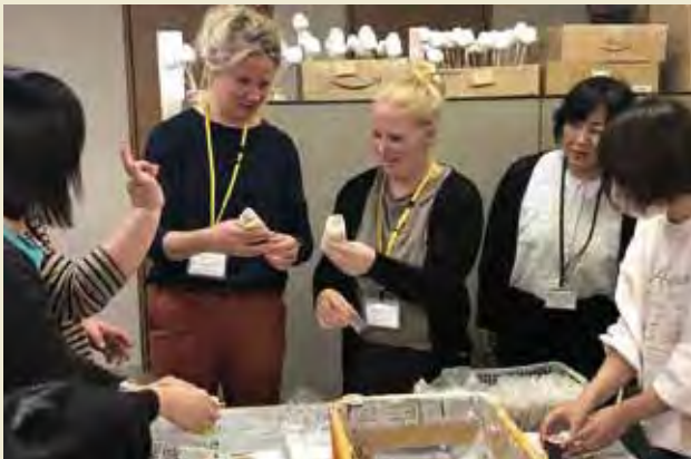
リハビリ型就労スペース「リハス」にて能登ヒバチップを詰める体験をする Trying out stuffing of Noto Hiba cypress at Rehabilitation-type Employment Space “Rihasu”