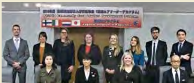
鹿児島県男女共同参画局局长を表敬訪問 Courtesy Visit to Director of Gender Equality Department of Kagoshima Prefecture