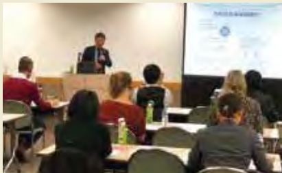
社会福祉法人全国社会福祉協議会 Japan National Council of Social Welfare

トピック1 「新しい連携・ネットワークで創造する共生社会」 Topic 1: New form of collaboration and network to create Cohesive Society