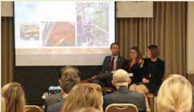
分野別発表（高齢者分野） Presentation of Outcome by Field of Activities (Older People)

After participating in NPO Management Forum and Regional Program, overseas invited youths from Finland, Italy and the Netherlands presented their outcome of participation in Tokyo on December 9th, 2019.