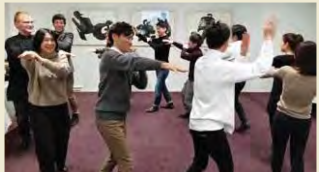
歓送会にて、ゲストに日本の盆踊りを披露する

Visiting newly built campus building of Tampere University