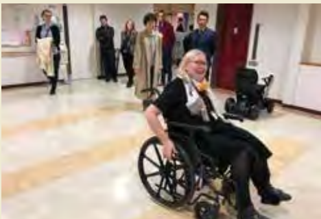
八雲公民館で東光グループが手掛ける福祉用具を体験 Testing assistive equipment produced by Toko Group at Yakumo Community Center