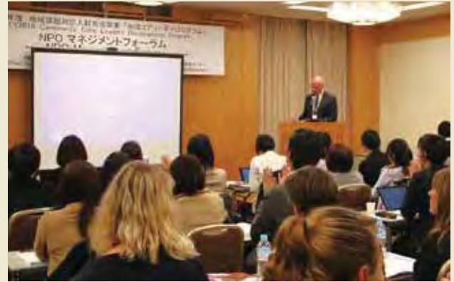
各国の非営利セクターに関する発表(イタリア団) Presentation on the non-profit sector in each country (Delegation of Italy)