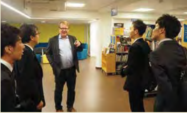
フィンランド国立青年評議会「アリアンシ」を訪問し、施設内情報センターを見学

Visiting Allianssi National Youth Council of Finland and learning about their information center