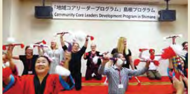
歓迎会にて島根の伝統芸能「銭太鼓」を体験 Joining performance of traditional drum show of Shimane “zeni-daiko” at the Welcome Reception