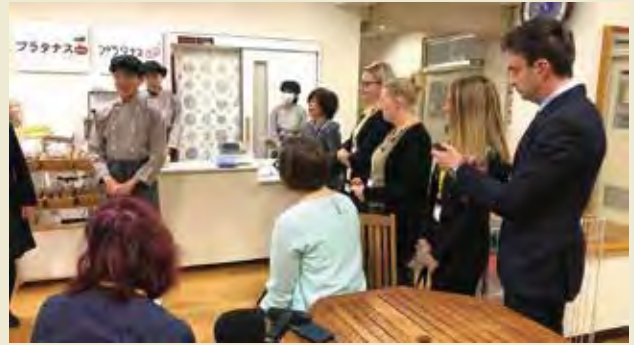
金沢大学附属特別支援学校にて生徒から職業訓練説明を受ける Visiting Special Education School attached to Kanazawa University and Learning about the job skill training from its students