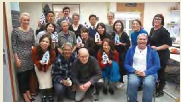
アムスタにて利用者と交流

Presenting on the situation of elderly's care in Japan at symposium hosted by Fundis Holdings