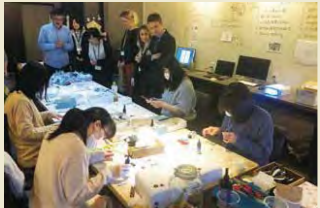
リハビリ型就労スペース「リハス」にて海洋プラスチックをアクセサリーにする作業を視察する Visiting Rehabilitation-type Employment Space “Rihasu” and its workshop producing accessories made with marine plastic waste