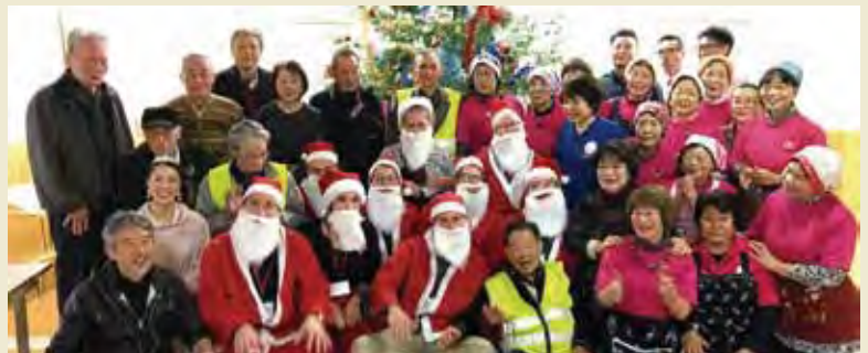
せんだん片江「なごやか寄り合い」を訪問し、地域の高齢者との交流 Visiting Sendan-Katae Friendly Gathering and interacting with elderly of the local community