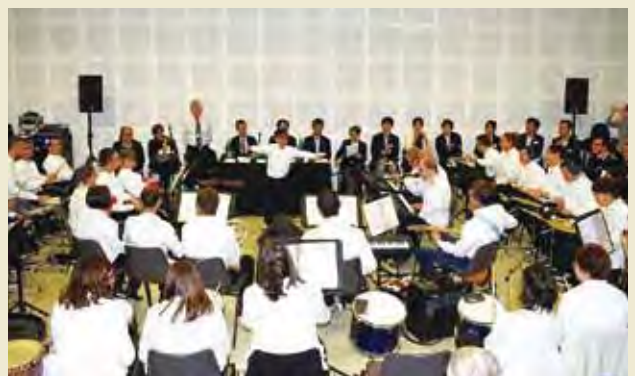
マジカムジカ協会にて日本国歌を含む演奏を聴く Listening to the performances including the Japanese national anthem at Magica Musica Association