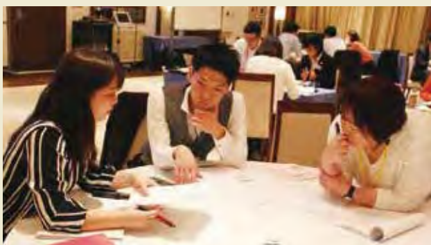
出発前研修でのNPOマネジメントフォーラムに向けた分野横断グループワーク Cross-thematic group work for NPO Management Forum at Pre-departure Seminar