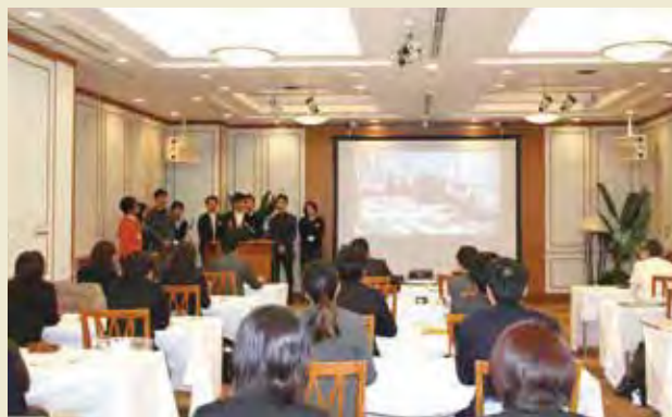
帰国後研修における成果発表（青少年分野） Presentation of Achievement at the Post-program Seminar (Field of Youth)