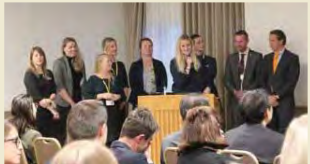
国別発表（オランダ） Presentation by Country (the Netherlands)