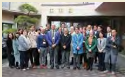
社会福祉法人江東園 Social Welfare Corporation Kotoen