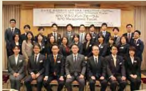
日本派遣団 Delegation of Japan