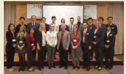
特定非営利活動法人シーズ C's (Coalition for Legislation to Support Citizens' Organizations)

トピック3 「政策決定・政治参加」 Topic 3: Policy making and political participation