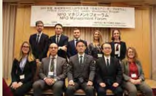
イタリア招へい団 Delegation of Italy