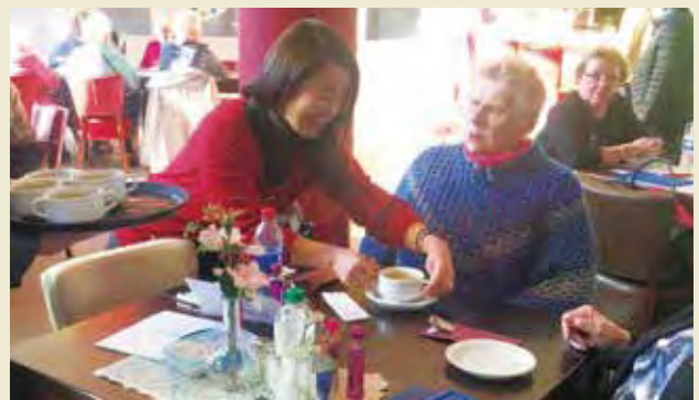
パレートウェルジンにて、利用者の配膳を手伝う

Trial of welfare supportive apparatus at Fundis