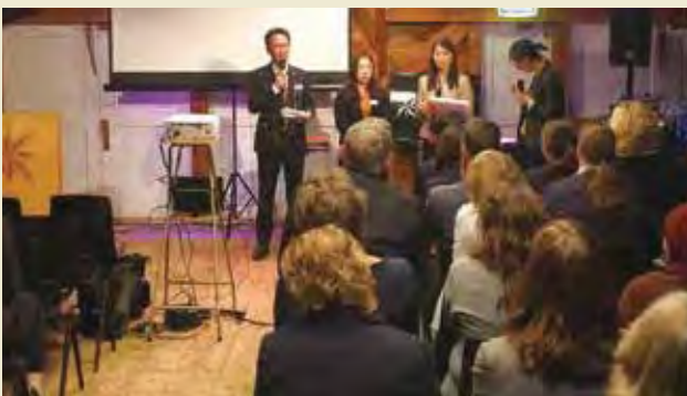
ファンディス・ホールディングス主催のシンポジウムにて、日本の高齢者支援の現状について発表する

Receiving explanation by a nurse at Vilans