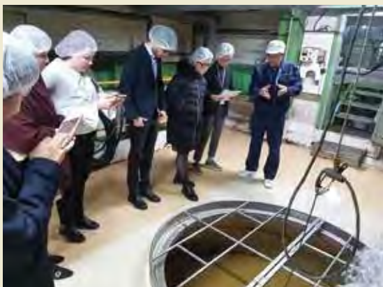
国分酒造にて芋焼酎の製造工程を見学する Visit to sake brewery Kokubu Shuzou and see the process of making distilled spirit