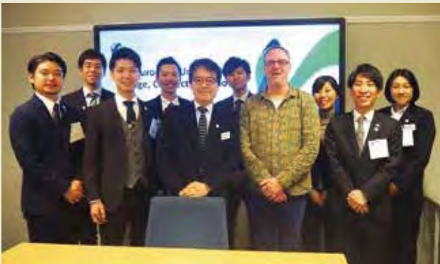
教育文化省を表敬訪問し、青少年行政について説明を受ける

Visiting Verke Centre of Expertise for Digital Youth Work and learning about their digitalization technology of hobby horse