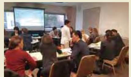
特定非営利活動法人ウィメンズアイ Non-Profit Organization Women's Eye (WE)