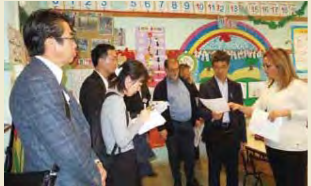
アントニオ・ロスミニ小学校にて学習計画の説明を受ける Receiving introduction of teaching plan at Antonio Rosmini Primary School