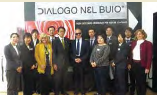
視覚障害研究所にて暗闇体験をする Experience of 'Dialogue in the Dark' at Institute of the Blind of Milan