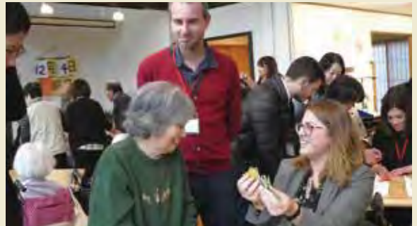
株式会社かすみコーポレーションの介護施設「六連星」にて利用者との交流 Visiting elderly's care house “Mutsuraboshi” run by Kasumi Corporation and interacting with service users