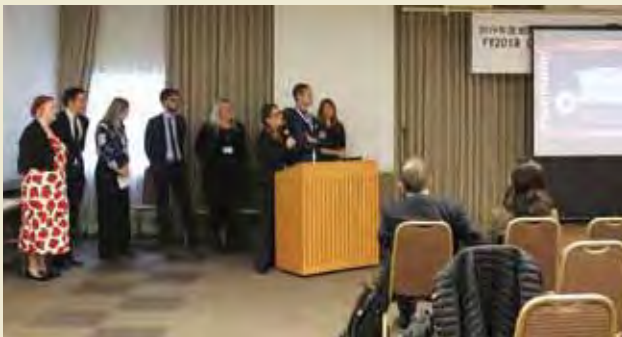
分野別発表（青少年分野） Presentation of Outcome by Field of Activities (Youth)