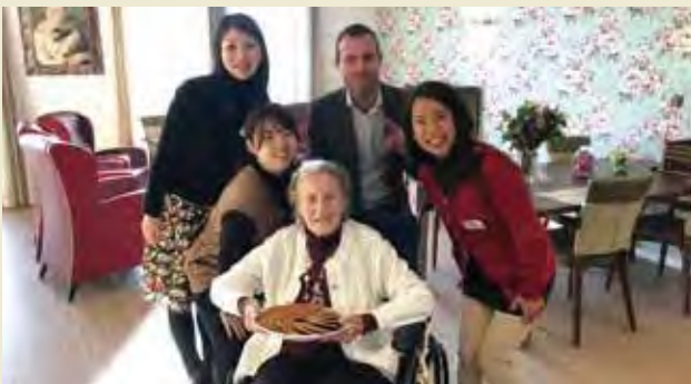
ローゼンタインにて、利用者の生活を見学する

Helping dish delivery for the users at Palet Welzijn