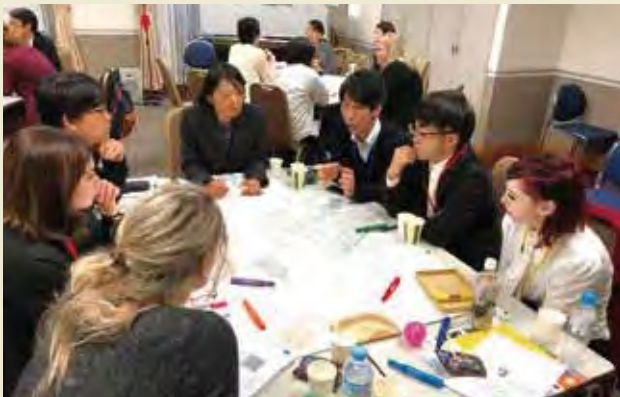
ディスカッションの様子(トピック1) Discussion (Topic 1)