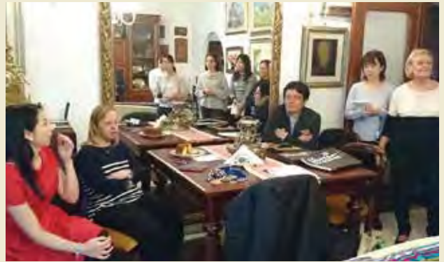
ホームビジット Home visit