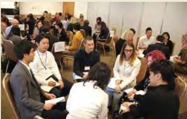
分野別交流会 Exchange session by field of activities