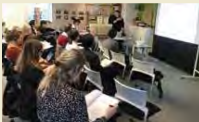
特定非営利活動法人ETIC. ETIC. (Entrepreneurial Training for Innovative Communities)