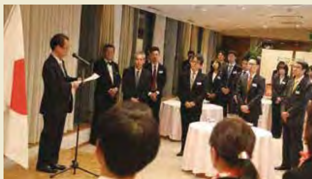
出発前研修の壮行会での内閣府による講評 Comment by Cabinet Office at the Send-off Party at the Pre-departure Seminar