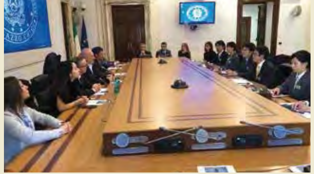
イタリア首相府にて意見交換する Discussion at The Presidency of the Council of Ministers of the Italian Republic