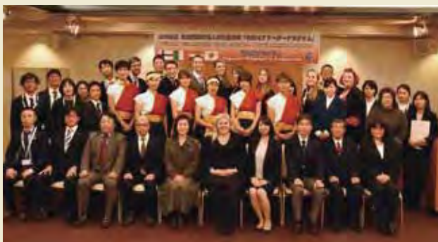
歓迎会 Welcome Reception