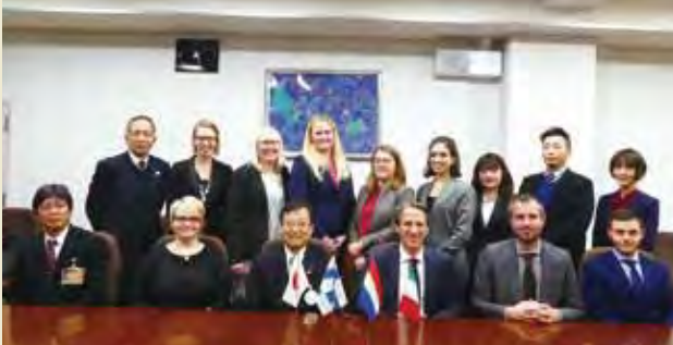
藤原孝行島根県副知事表敬 Courtesy Visit to Mr. Takayuki Fujihara, Vice Governor of Shimane Prefecture