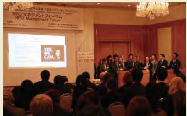
成果発表会(トピック3) Presentation of Outcomes (Topic 3)