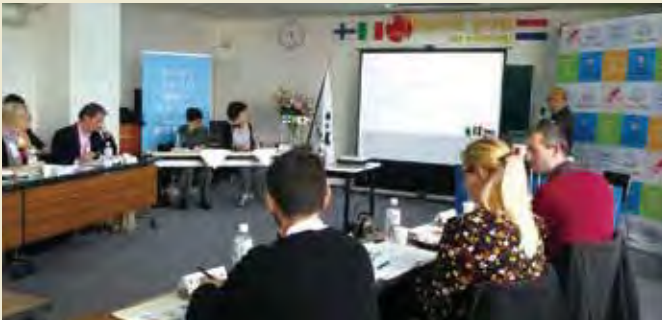
松江市社会福祉協議会を訪問 Visiting Matsue Council of Social Welfare