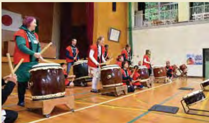
平山小学校にてやまびこ太鼓のたたき方を学び実践する Experience beating Taiko learned from Yamabiko Taiko members at Hirayama Elementary school