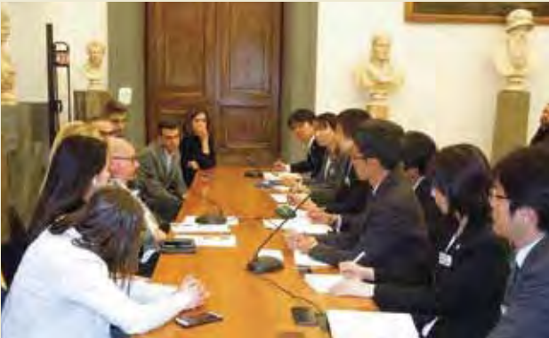
ローマ市庁舎にて意見交換する Discussion at Municipality of Rome