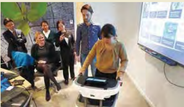
ファンディスにて福祉用具を体験する