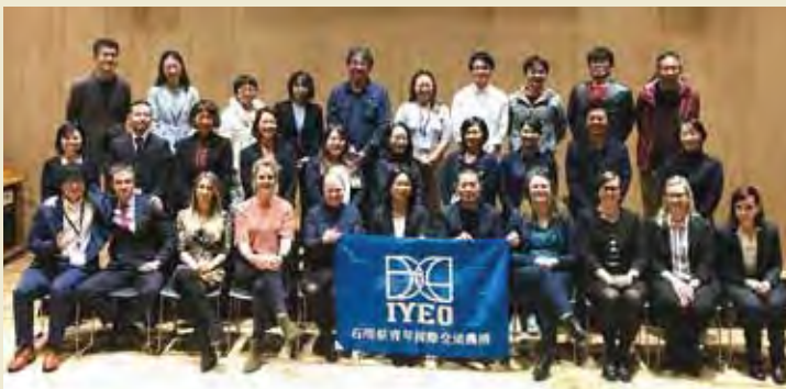
地方セミナー Local Seminar