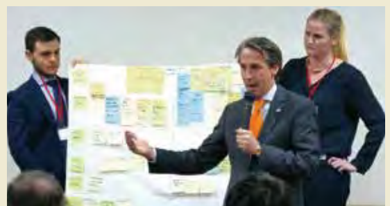
地方セミナーにてグループディスカッションの成果発表 Presenting the results of group discussion at Local Seminar