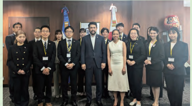
在京ドミニカ共和国大使館にてタカタ大使を表敬訪問する（事前研修）