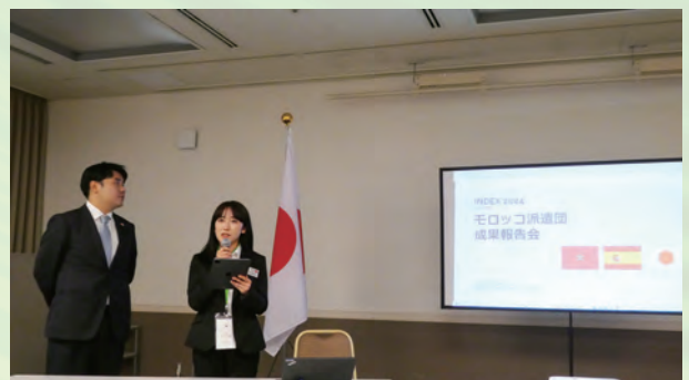
成果発表会で本事業の成果をまとめ、 派遣団ごとに発表するモロッコ派遣団（帰国後研修）