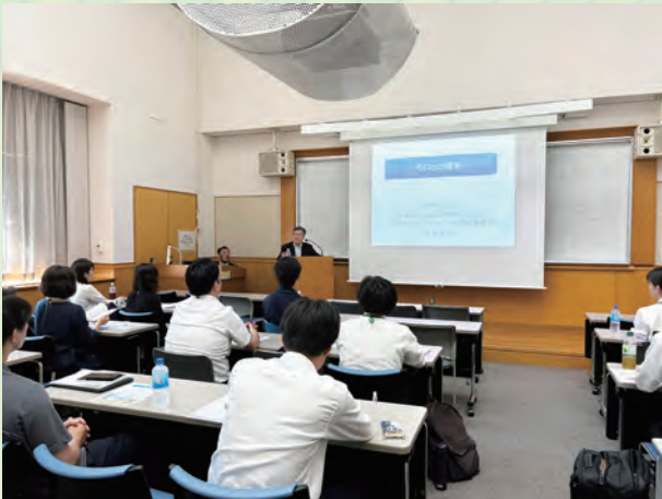
花谷元駐モロッコ大使から、モロッコ事情について伺う（事前研修）