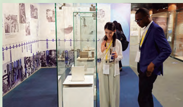
東京都水道歴史館を訪問し、日本の上水道の歴史を学ぶ