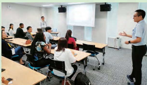
気象庁を訪問し、日本の防災情報の提供の取組について講義を受ける