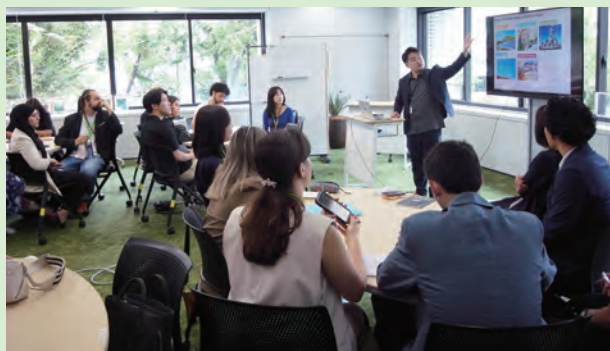
資源エネルギー庁を訪問し、日本の再生エネルギーに関する取組について講義を受ける