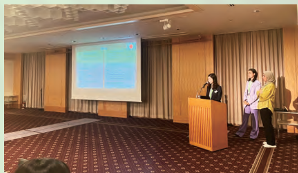
成果発表会でグループで話し合った内容を披露する