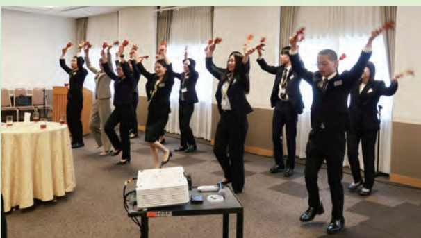
自主研修期間中に練習した日本文化紹介のよさこいを披露する ドミニカ共和国派遣団（出発前研修）