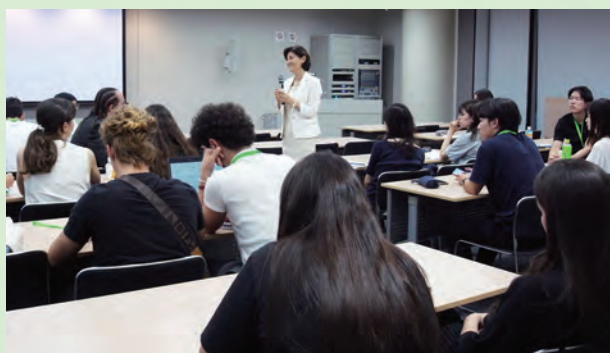
イベルドローラ・リニューアブルズ・ジャパン(株)の事業内容について説明を受ける