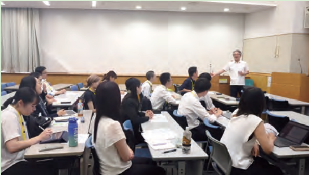
牧内元駐ドミニカ共和国大使から、ドミニカ共和国事情について伺う（事前研修）

日本青年外国派遣団は、事前研修、出発前研修及び帰国後研修を通じ、本事業への理解を深めるとともに、団の結束を固め、事後活動への意識を高めた。