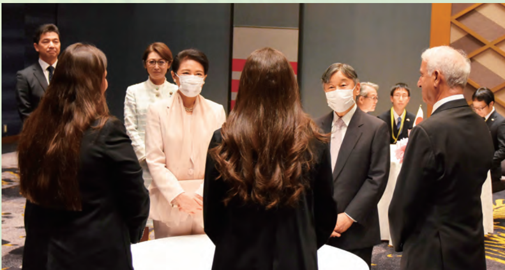
参加青年代表とご懇談される天皇皇后両陛下