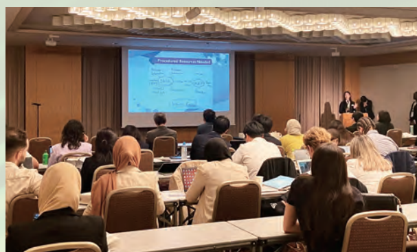
成果発表会でグループで話し合った内容を披露する