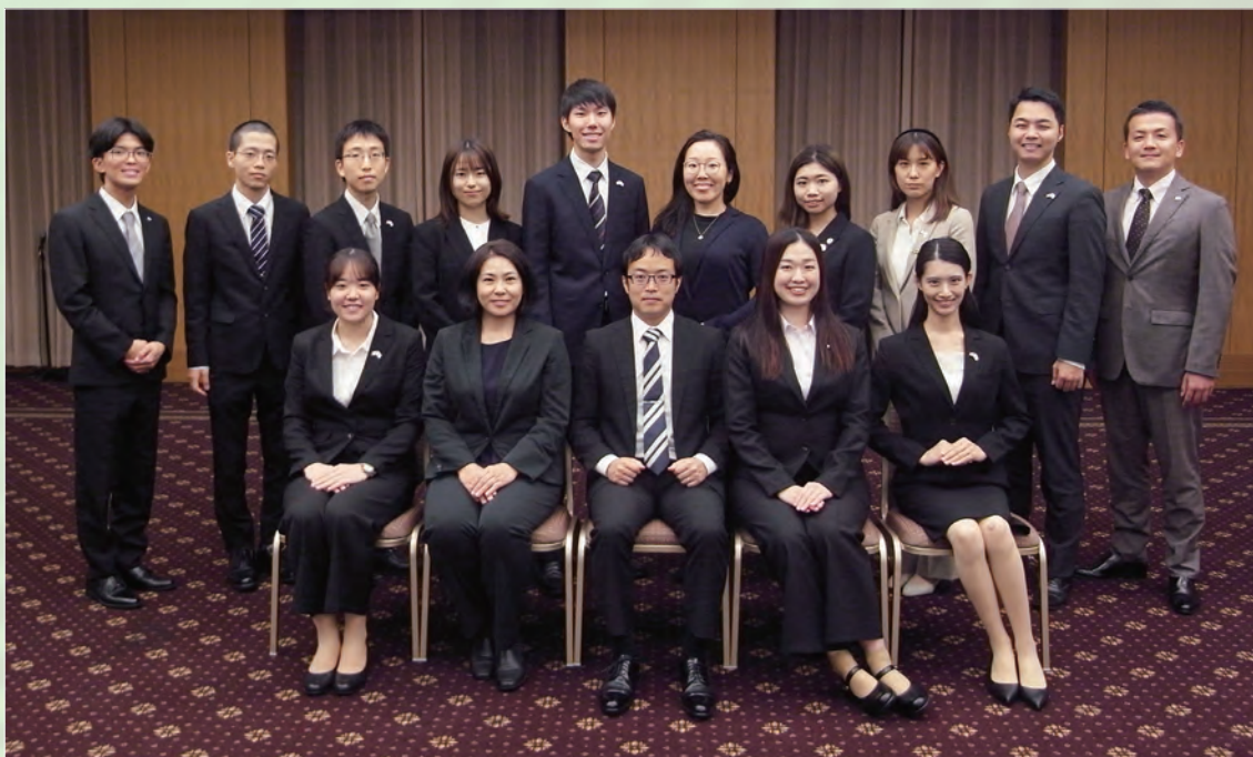
<ドミニカ共和国派遣団>