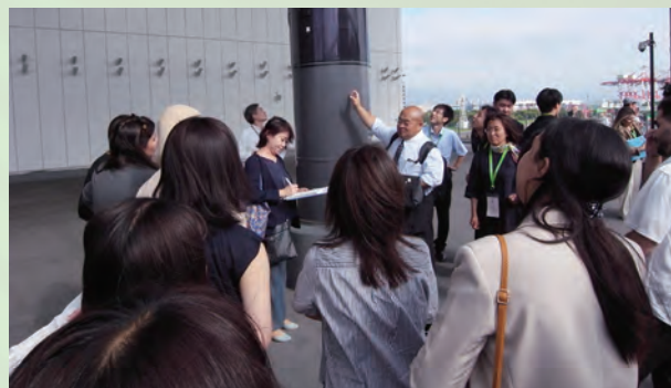
積水化学工業(株)の実証実験サイトを見学する