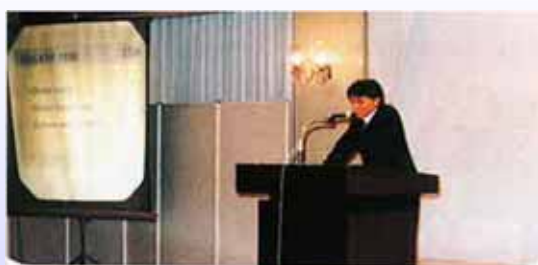
エッセイを発表する、 インドネシア人のエッセイ優勝者

「東南アジア青年の船」事業の25周年を記念して、SSEAYPインターナショナルが行ったエッセイコンテストに参加しました。