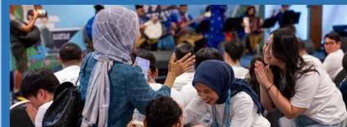
ホームステイマッチングの様子