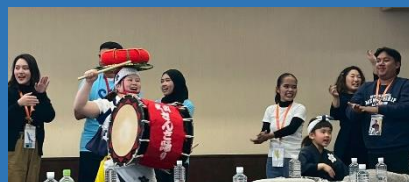
地方プログラムの様子