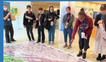
課題別視察の様子