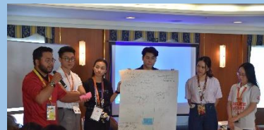
ディスカッションの様子