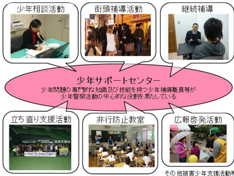
第2-3-8図 少年サポートセンター

市町村に置かれている青少年センターでも、市町村などから委嘱された少年補導委員による街頭補導や有害環境の適正化の活動が行われている。