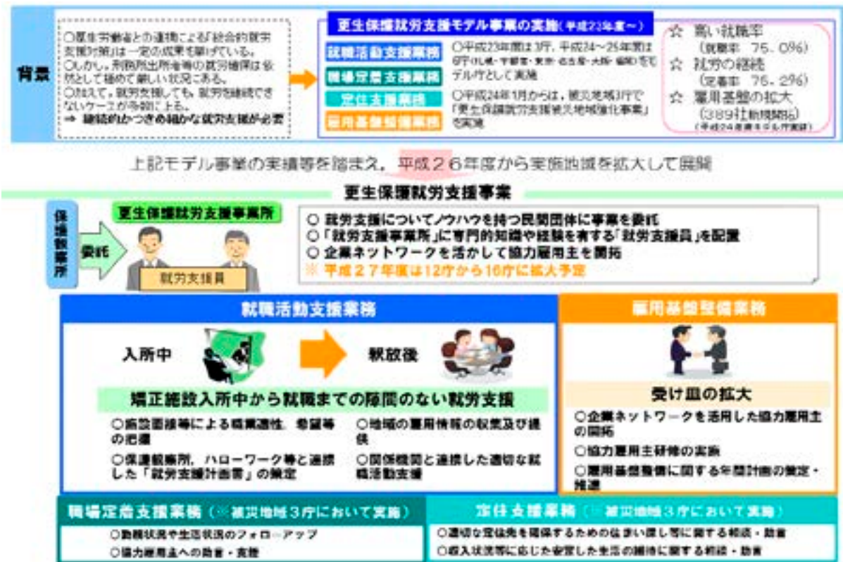
図表 13 更生保護就労支援事業の概要