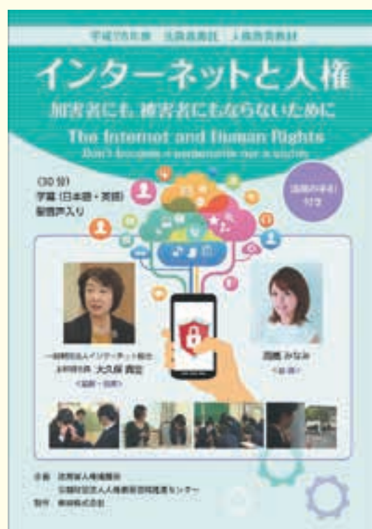
第4-21図 インターネット人権啓発ビデオ

警察庁は、一般のインターネット利用者などからの違法情報等に関する通報を受理し、警察への通報やプロバイダ、サイト管理者などへの削除依頼を行うインターネット・ホットラインセンターを運用している（第4-22図）。同センターでは、平成28（2016）年には277,667件の通報を受理しており、プロバイダなどに対して17,106件の違法情報の削除依頼を行い、そのうち16,838件（98.4%）が削除された。外国のウェブサーバに蔵置された児童ポルノ情報についても、当該外国の同種の機関に対し削除に向けた取組を依頼している。