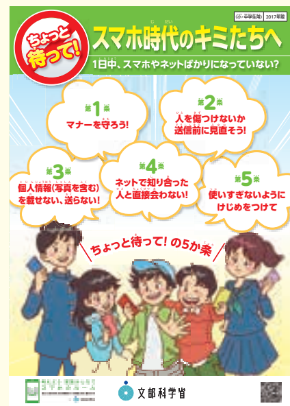
第4-24図 インターネットに関する児童生徒向けの普及啓発資料