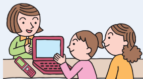
フィルタリングサービスの提供や販売