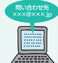
問い合わせ窓口の整備