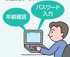
有害情報の閲覧防止の措置